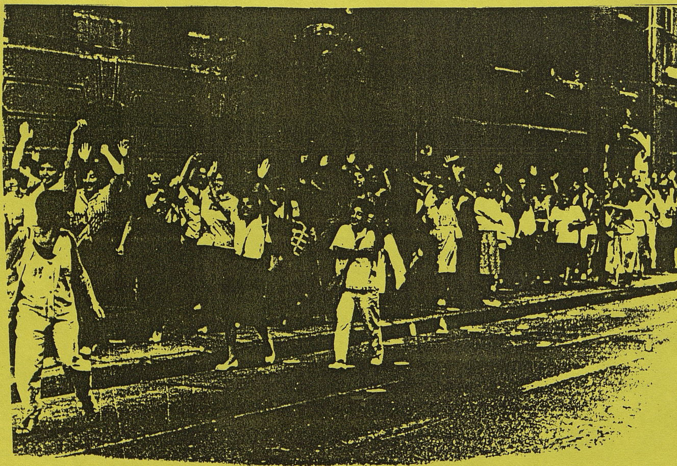
Manifestation à Santiago.