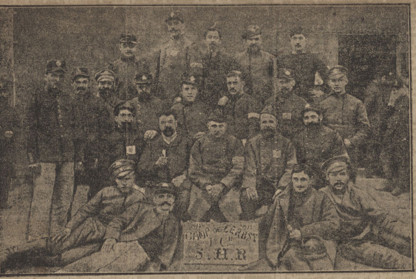
FRANÇAIS ET RUSSÉS PRISONNIERS AU CAMP DE ZERST.