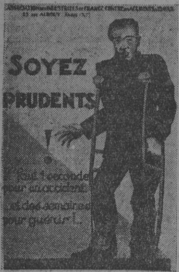
(De la "Chronique de la Sécurité Industrielle").