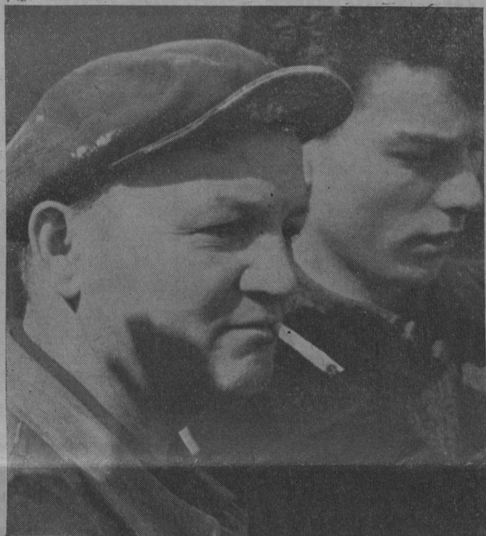
To w przyszłości członkowie naszych syndykatów... jeżeli wszyscy weźmiemy udział w akcji propagandowej.

Otóż i my w tym roku chcemy przeprowadzić akcję, która by mogła doprowadzić do tego, aby jeszcze więcej naszych rodaków mogło zapoznać się z działalnością akcji syndykatów chrześcijańskich, z ich ideologią, z ich programem. A jednocześnie chcielibyśmy, aby rozszerzyć grono naszych czytelników i w ten sposób umocnić podstawy finansowe naszego wydawnictwa.