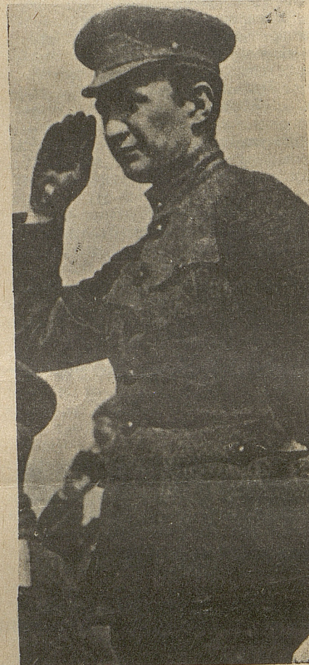
El Kerensky original

Estas situaciones de poder dual acentúan aún más la inestabilidad y crisis del régimen