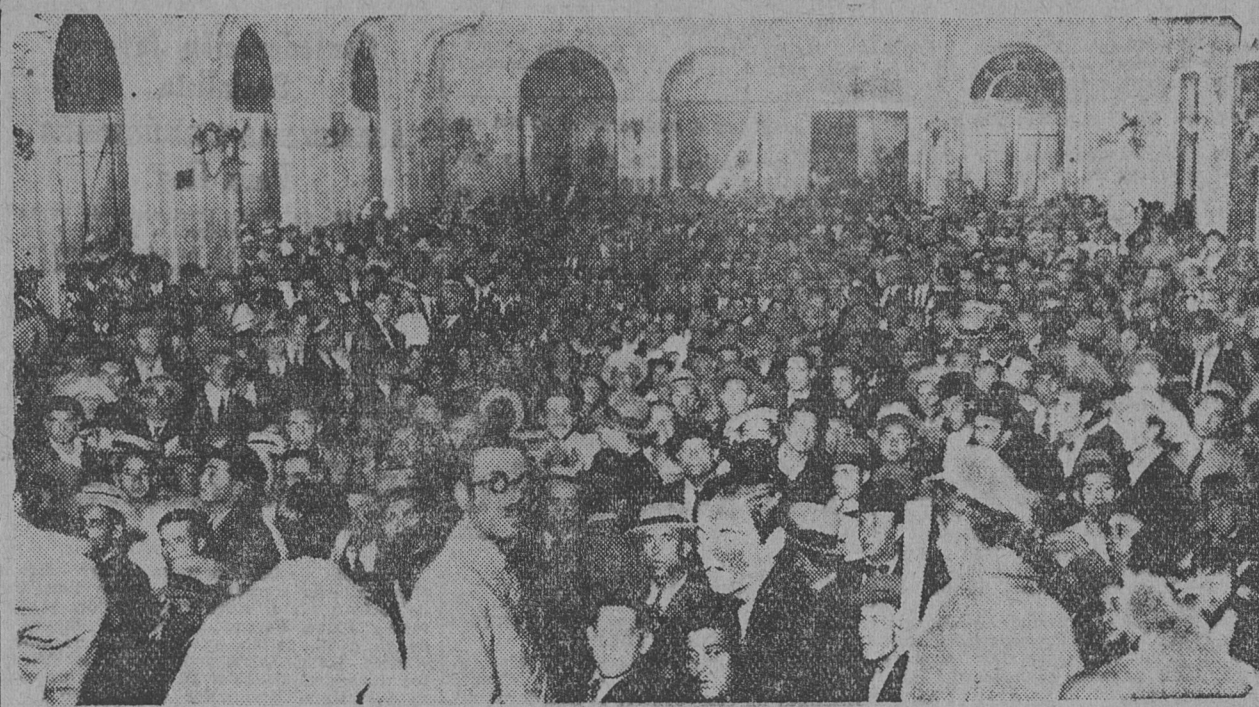
ASAMBLEA DE LOS OBREROS DEL CALZADO, EN SARMIENTO 2417