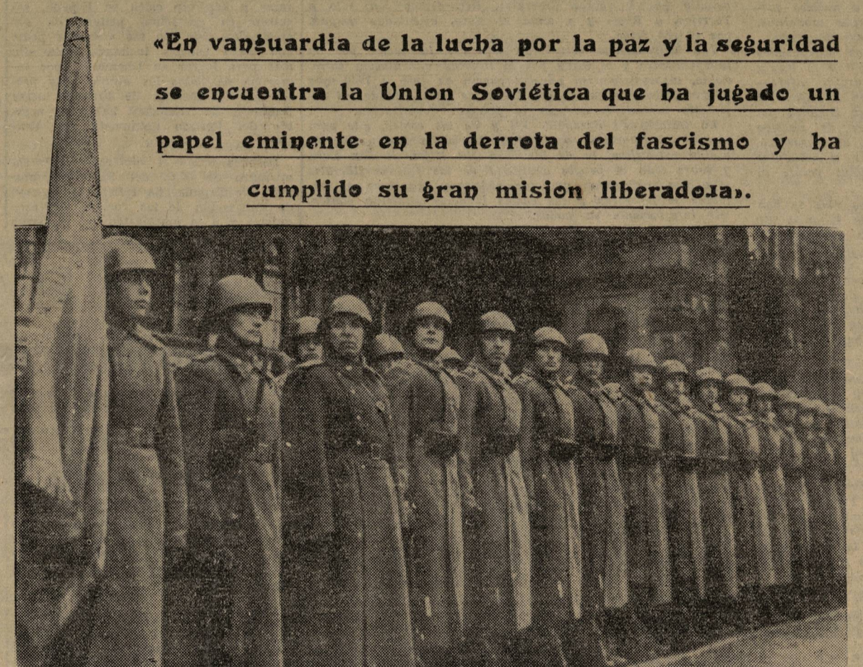
Filas del Ejército Rojo ayer vanguardia y ariet de la victoria, hoy fiel guardian de la paz.

Los pueblos del mundo no quieren que se repitan las calamidades de