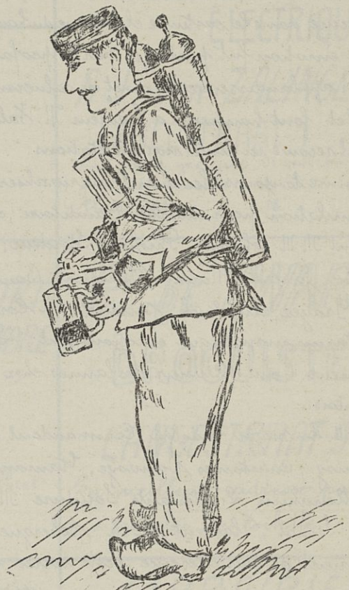
Van Herom Fr 1916

S'on dit que... le camp possède des vendeurs de Coco. Les jours de promenade, ils débitent à leurs camarades un délicieux breuvage.