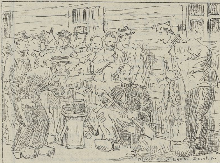
La chasse aux rats.