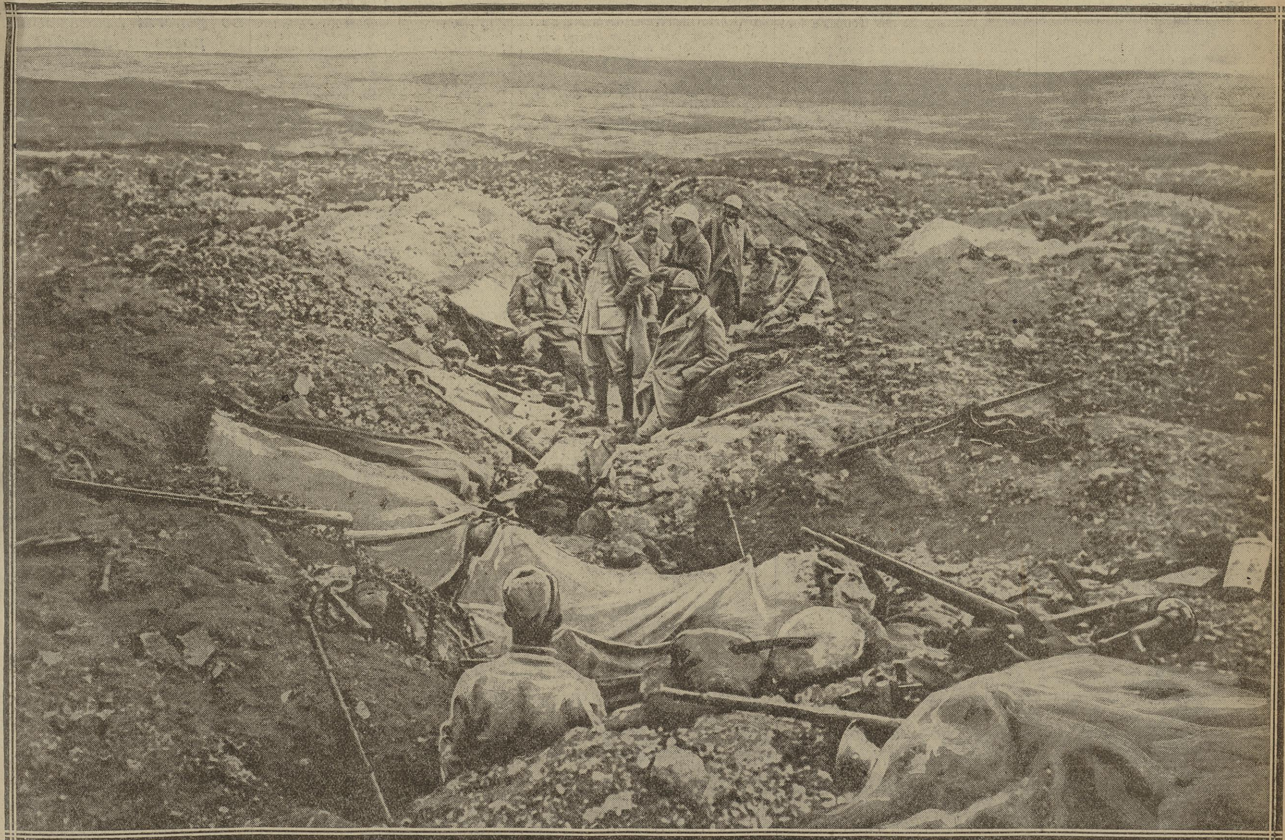
POSTES AVANCÉS FRANÇAIS AUX ABORDS DE LA COTE 304 QUI FUT ENLEVÉE DANS UN IRRÉSISTIBLE ASSAUT

Avec leur fougue habituelle, nos troupes ont attaqué, hier matin, les positions ennemies situées entre le bois d'Avocourt et le Mort-Homme. Elles ont rapidement conquis le bois Camard et la cote 304 dont la possession fut si souvent disputée depuis le printemps de 1916