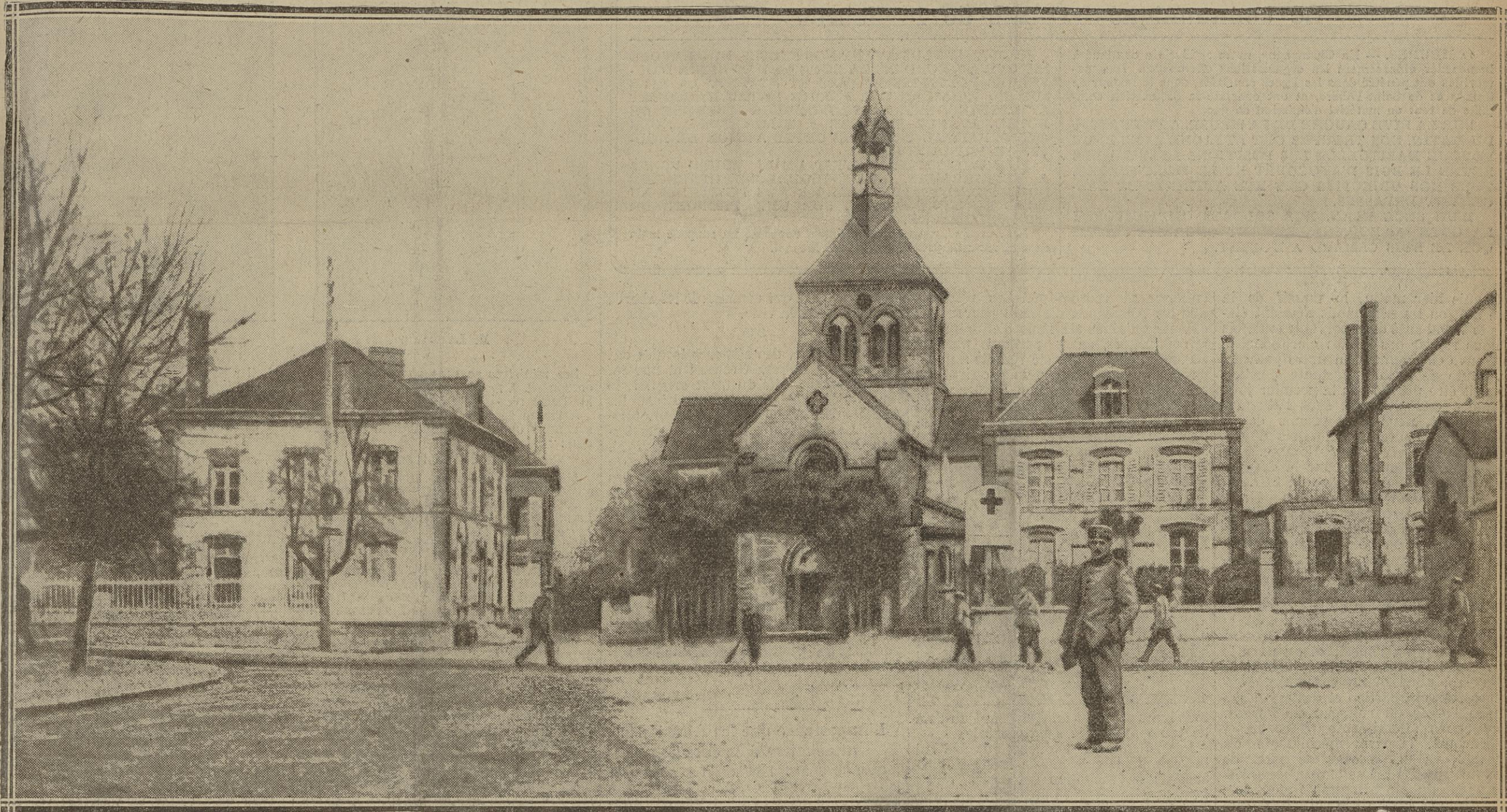
LE VILLAGE DE BETHINCOURT PRÈS DUQUEL NOS LIGNES SONT ACTUELLEMENT ÉTABLIES (DOCUMENT ALLEMAND)

NOS TROUPES SE SONT EMPARÉES HIER DE LA COTE 304