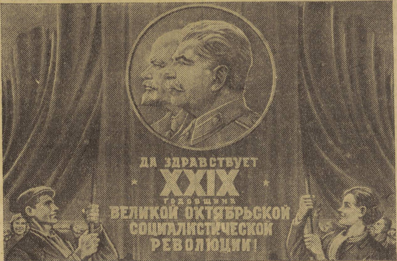
Uno de los carteles editados en la Unión Soviética para conmemorar el 29 aniversario de la Revolución Socialista.

lítica de paz, de ayuda a la independencia y libertad de los pueblos que lleva a cabo la U.R.S.S. En particular, se intentó presentar en ciertos sectores el veto que el delegado soviético Gromyko puso a la propuesta australiana, ante el Consejo de Seguridad, como un acto contrario a los in-