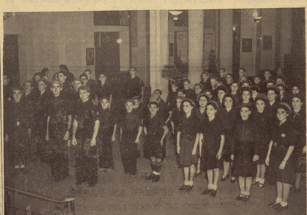
Nuestros flechas formados a la entrada de la Sala Pleyel en la Fiesta de la Hispanidad

El secretario del ministro de Relaciones Exteriores, altos funcionarios de los Ministerios de Hacienda y Agricultura; el ex embajador de Madrid, García Mansilla; el ministro Guillermo Acaval, el ministro de Cuba en Buenos Aires, Ramiro Hernández; otros jefes de Misiones diplomáticas, el intendente municipal, Pueyrredón; el jefe de Policía, general Martínez; el embajador de España, almirante Ma-