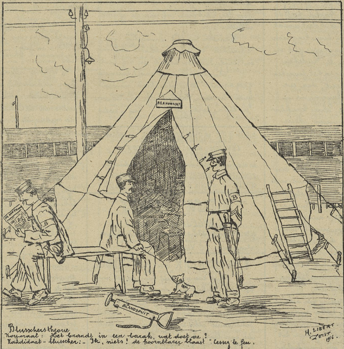
Blusschers theorie Korporaal: Heet brandt in een barak, wat doet ze? Kandidaat-blusscher: - Ik, niets! de hoornblazer blaast "Lessez le feu."

Drie honderd milliar-den! Nauwelijks genoeg om de meeste misdaad die eens den mensch tegen den mensch beging te betalen. Alles, er op los! Van dan begon het in het diepe van den afgrond te hoken en te dwaarelen; door den donderen-den krater schoten vlammen en golven van ruwe, verlikken-de rookwolken, kreten van woede en van pijn, ver-scheurde ledematen en boven dat alles het gebul van "Gott mit uns". 't gaat goed! 't gaat goed! maar 't moet nog meer geld kosten. Ga voort! - R.S.