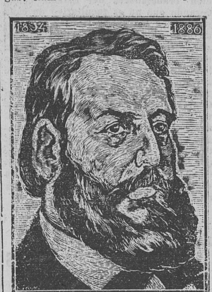
JOSE HERNANDEZ, EL CREADOR de "Martín Fierro", según una xilografía de Bellocq

"El gaucho dividía sus faenas entre el apesamiento del ganado salvaje y su domesticación a campo raso. Poseía un espíritu contemplativo y religioso. Falto de escuelas, su filosofía era simple ciencia de la vida, formulada en abundantes sentencias y refranes. Vivía en la admirable sencillez de los hombres primitivos; era sobrio y hospitalario como los pastores de las eglogas; llamaba "hermanos" a sus prójimos."