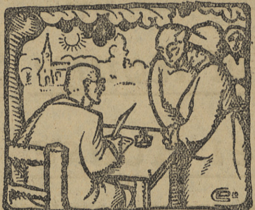
embarassés, maintenant, pour écrire au mari, au frère, au fils parti aux armées.

Gertrude, parfois souriait. Mais ce n'était pas à son Dieu... Et ce sourire à l'humanité livrait sa pensée qui s'enlaidissait encore dans le profane.