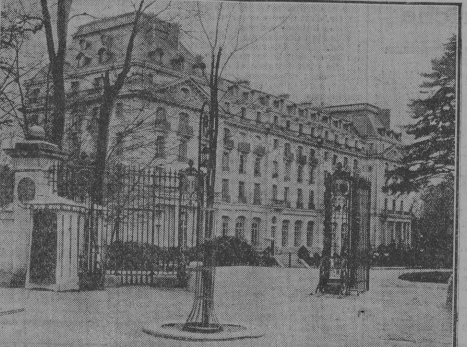
OU DOIT SE TENIR LA CONFÉRENCE DE LA PAIX

des autres ministères d'Etat et des autorités, comme commissaires. Font aussi partie de la délégation, des spécialistes financiers et économiques et des membres de la commission d'armistice. La délégation sera accompagnée par le personnel de chancellerie nécessaire. L'ancien ministre de la guerre prussien, M. Wriesberg, sera remplacé par le général de Seeckt.