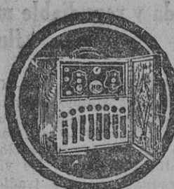
Este set, muy moderno, a $ 280

SI NO ES HOY SERA MAÑANA COMPRE SUS MUEBLES A