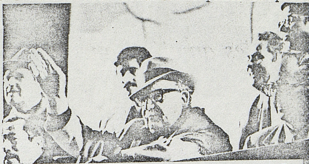
SANTIAGO. 4 de Septiembre de 1973

Desde esos días, la dictadura, semiparalizada en sus acciones represivas, ha presenciado las manifestaciones contra el "plebiscito" (Diciembre-Enero) - la concentración del 1° Mayo - la huelga de hambre (Mayo-Jun) - el "paro de las viandas" en Chuqui, que los obligó a declarar en la zona el Estado de Sitio "en el grado de conmoción interna" - la constitución de la Coordinadora Nacional Sindical, que representa a más de un millón de trabajadores y será la base de la nueva CUT - la conti-