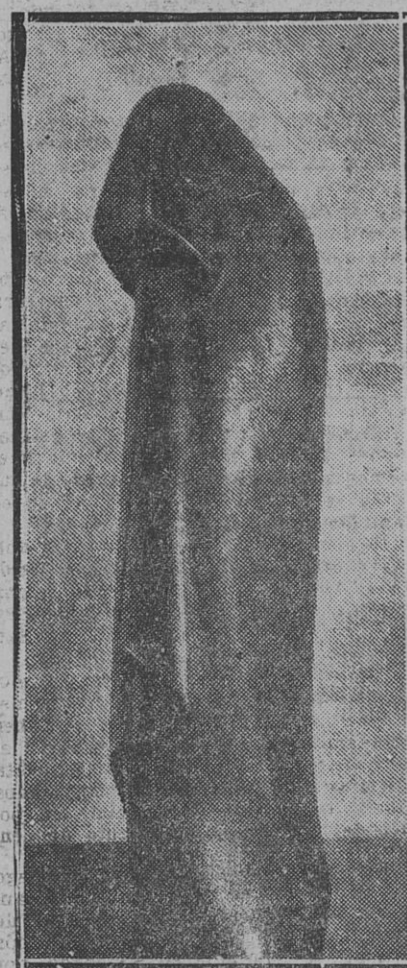
"PENITENTE" (Curupa), por Alfredo Simonazzi