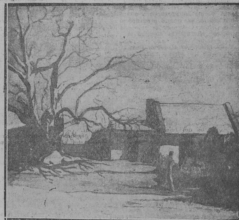
"EL PUESTO", acuarela por Fausto Mazzucchelli