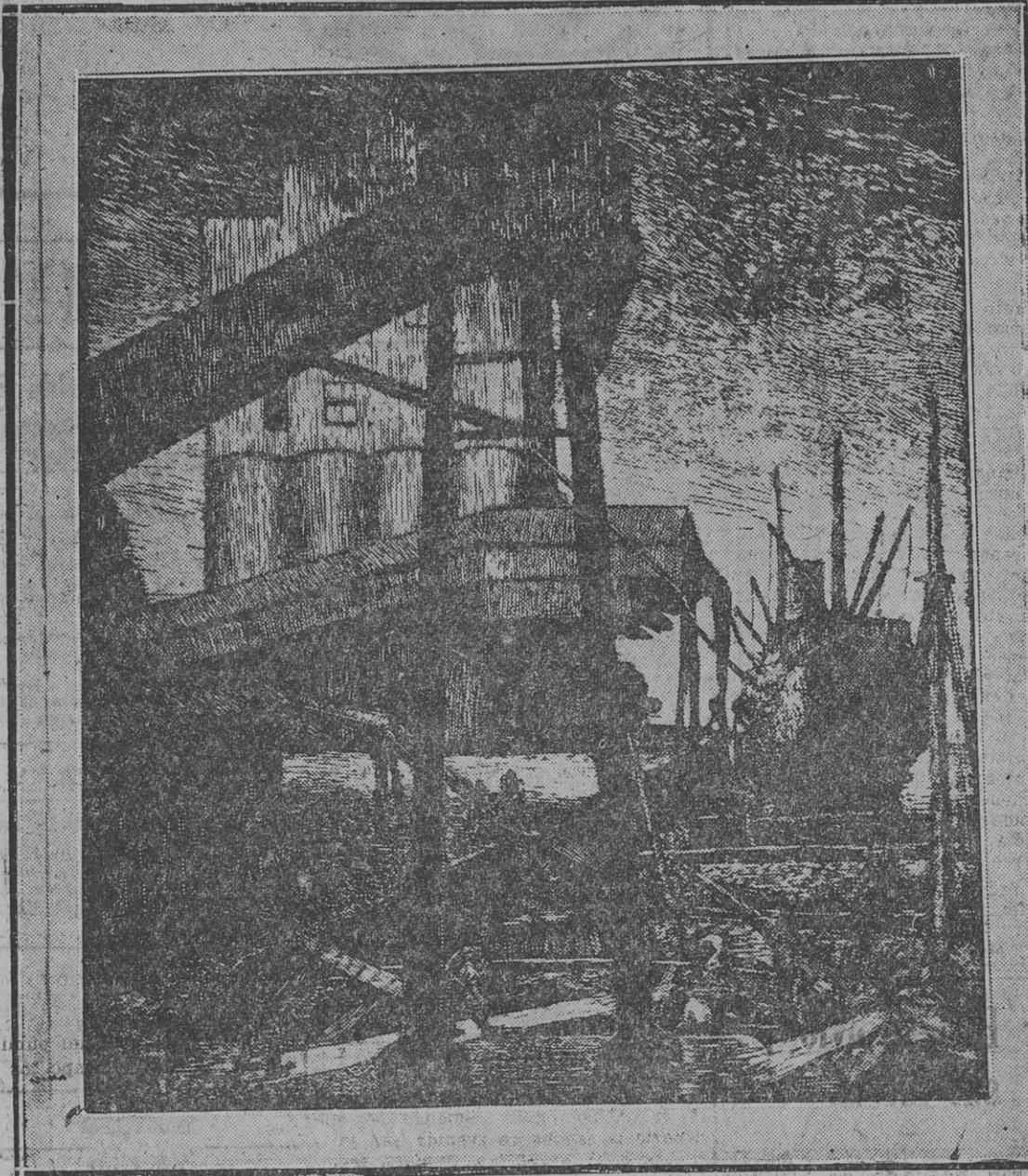
"ELEVADORES DE GRANOS" xilografía de Francisco A. de Santo.

La municipalidad de Viena ha realizado exposiciones y concursos de muebles, y aún de muebles que podrían hacer los mismos "consumidores". Para salir de la situación angustiosa que amenaza al mundo entero, no hay más que un sendero: producir, crear, pensar, actuar, organizar, vivir en fin cor