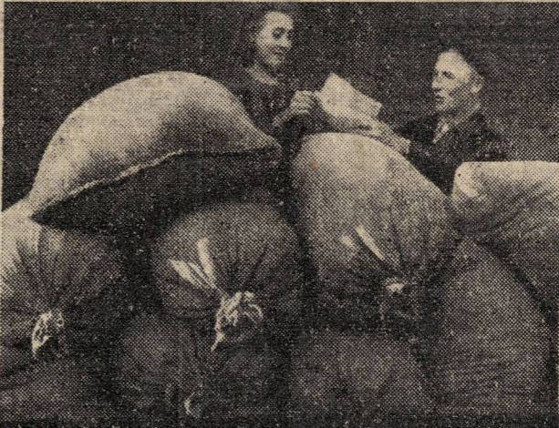
Distribución del pienso en el coljós «Krasnaia Zaria», especializado en la cria caballar.