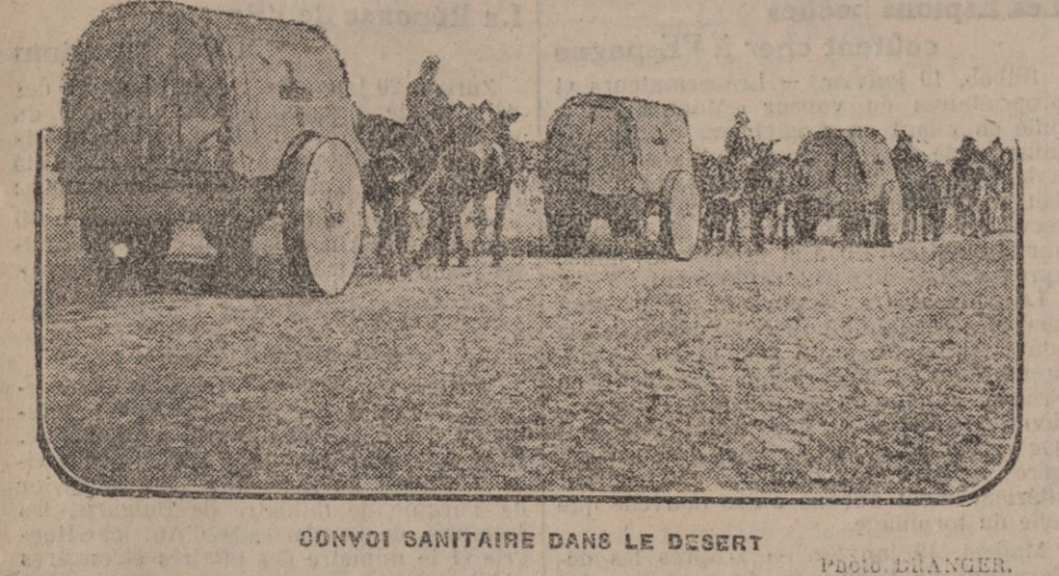
CONVOI SANITAIRE DANS LE DESERT