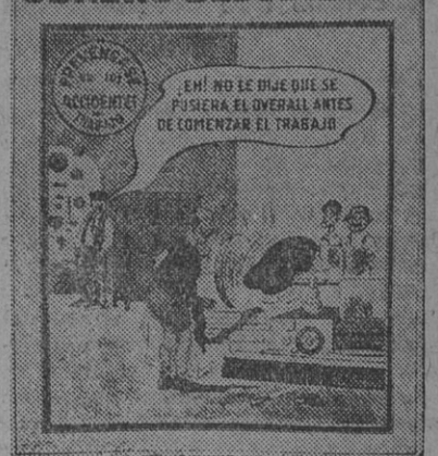
(Lámina de un trabajo del doctor Tiscornia)

los industriales deberán caer aunque quieran resistirse más de lo que pueden.