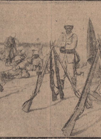
UNE HALTE EN PLEIN DESERT.