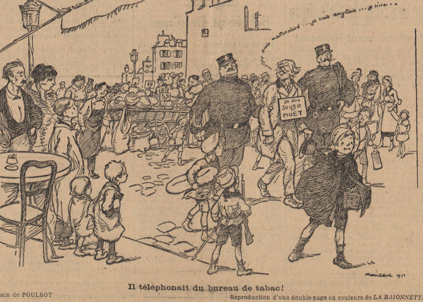
Il téléphonait du bureau de tabac! Dessin de POULBOT. Reproduction d'une double-page en couleurs de LA BIJONNETTE.

Il ouvrit la porte de l'appartement. Vous voyez, vous voyez, j'ai donné quelques ordres, à la hâte, pour que vous n'ayez pas trop à souffrir d'une première installation.