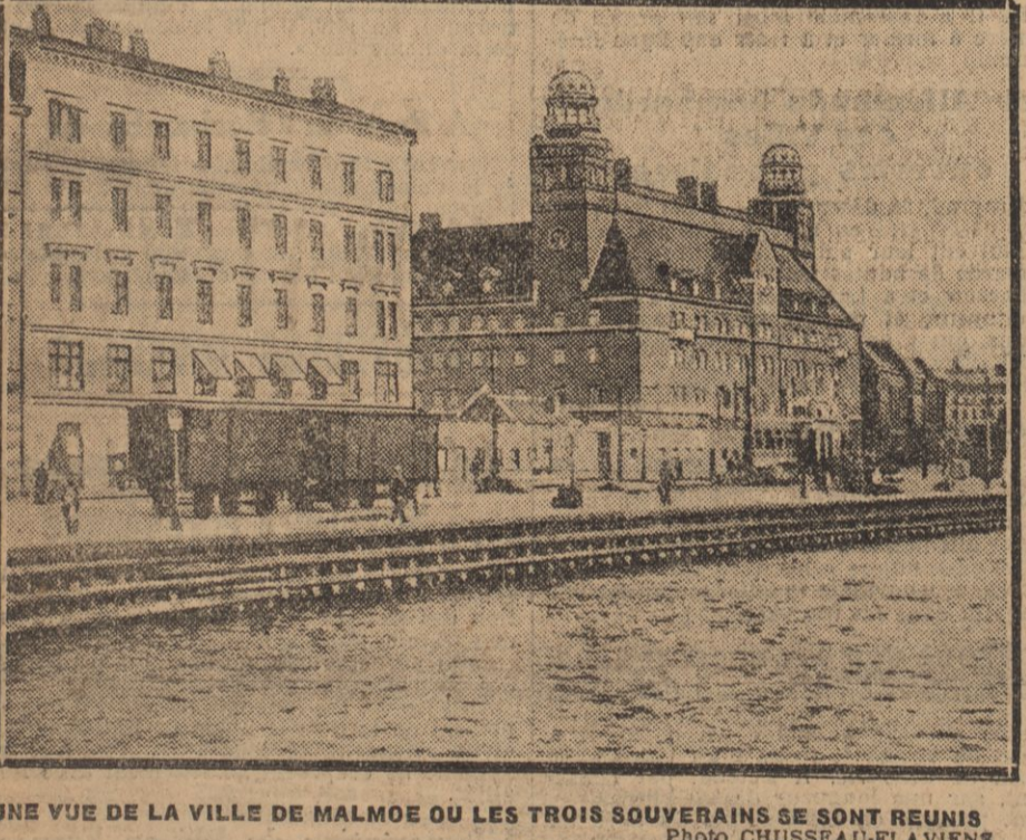
UNE VUE DE LA VILLE DE MALMŒ OÙ LES TROIS SOUVERAINS SE SONT REUNIS