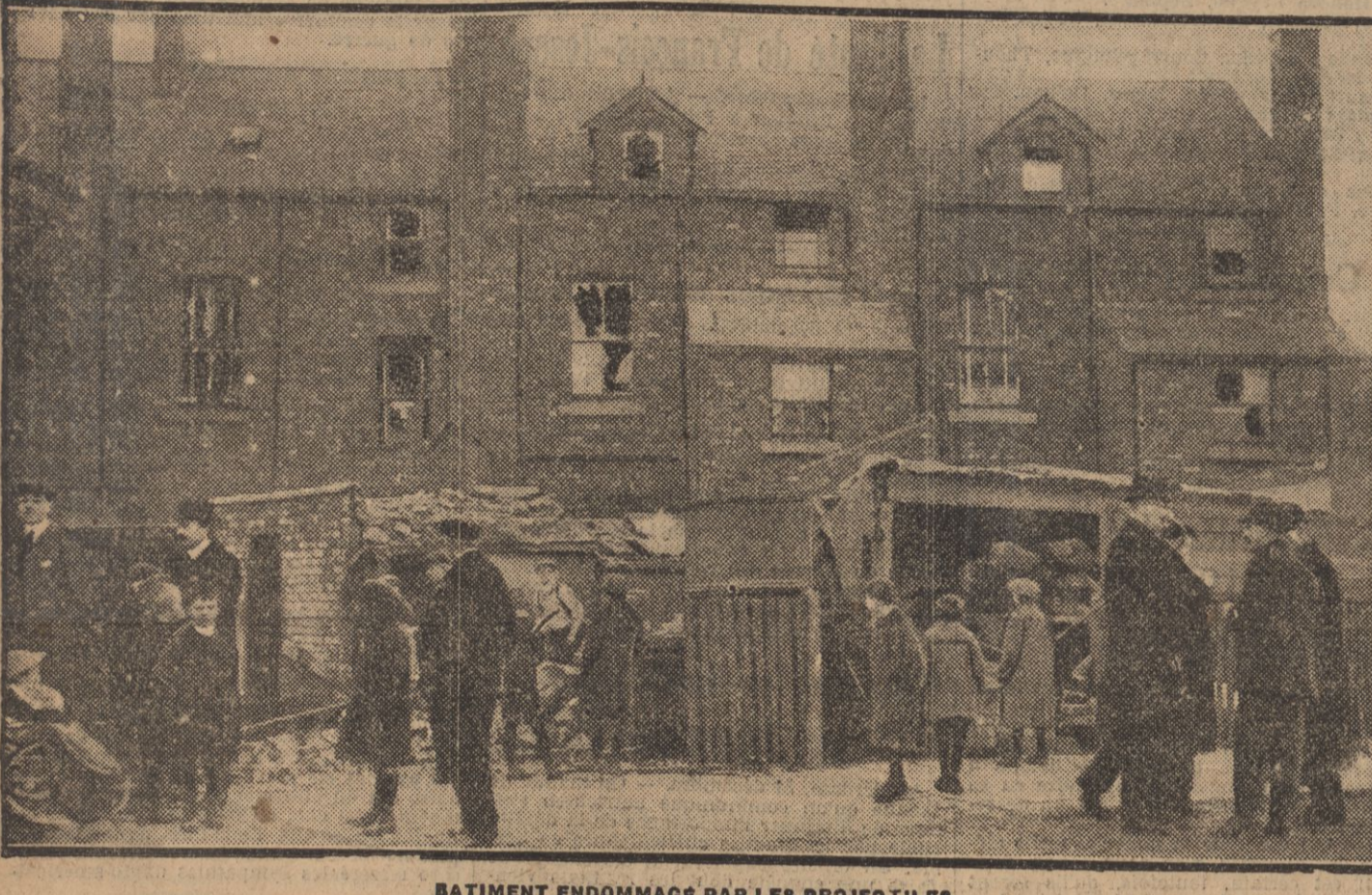
BATIMENT ENDOMMAGE PAR LES PROJETS TILES