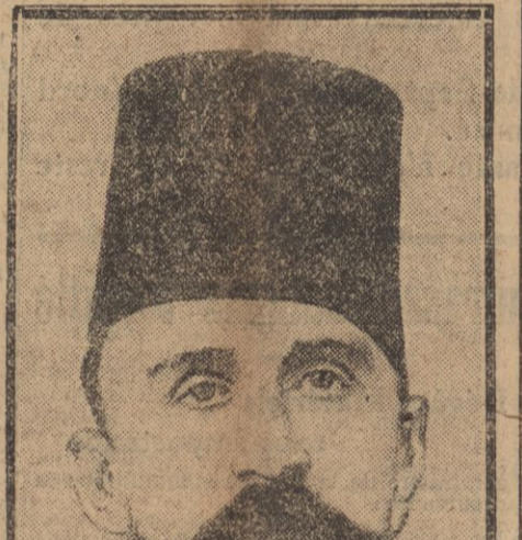
LE NOUVEAU SOUVERAIN D'EGYPTE