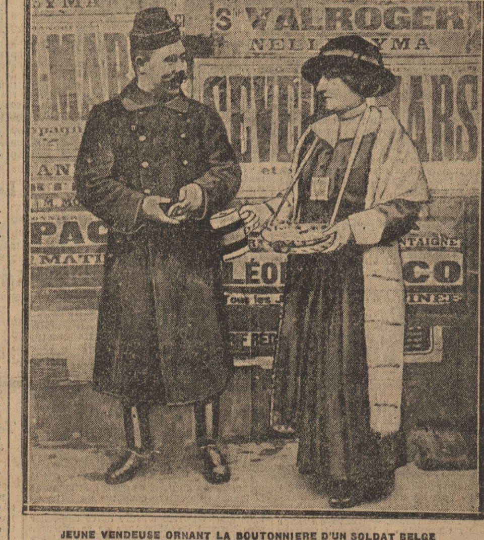
JEUNE VENDEUSE ORNANT LA BOUTONNIERE D'UN SOLDAT BELGE