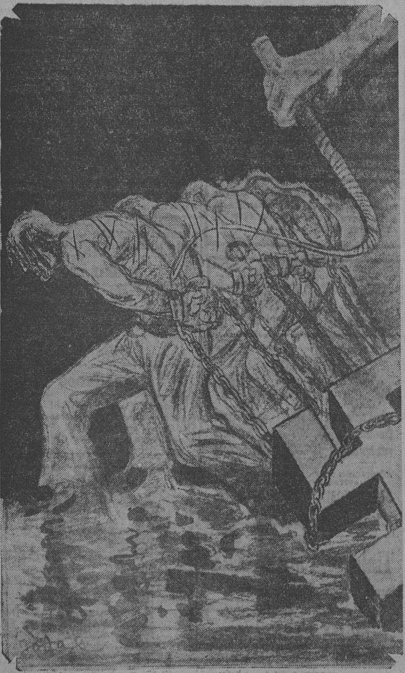
El noble pueblo de una gran nación, bajo el látigo.