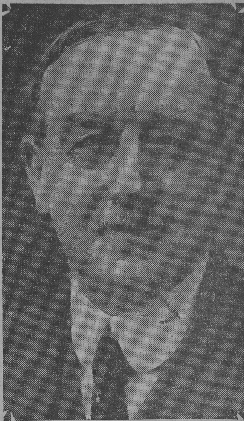
ARTURO HENDERSON, DESTACADO LIDER DEL PARTIDO laborista inglés y presidente de la Conferencia del Desarme, autor del artículo "¿Queremos la Paz?", que se publica en esta página.

No es por mero accidente que muchos de los que creen en el militarismo consideren que el lugar de la mujer es exclusivamente el hogar; y es interesante observar que los países democráticos y amantes de la paz son aque-