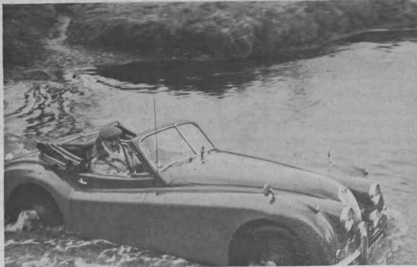
Prezes Polskiego Klubu Motorowego Mieczysław Bialkiewicz w chwili przeprawy przez bród w czasie „Raidu Nocnych Myśliwców” Patrz sprawozdanie w „Przeglądzie Sportowym” na str. 8-mej.