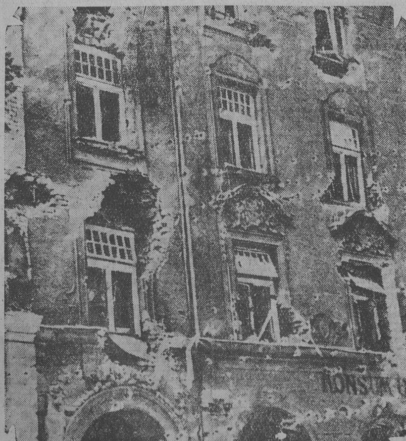
ASPECTO DEL FRENTE DE UNA DE LAS CASAS COLECTIVAS DE VIENA, después de sufrir los efectos de la metralla del gobierno.

Todo comentario es superfluo. O bien todas estas cosas han sido escritas para el único caso en que los mandatarios del Papa no sean los dictadores, o bien Dollfuss había desconsiderado del espíritu del cristianismo".