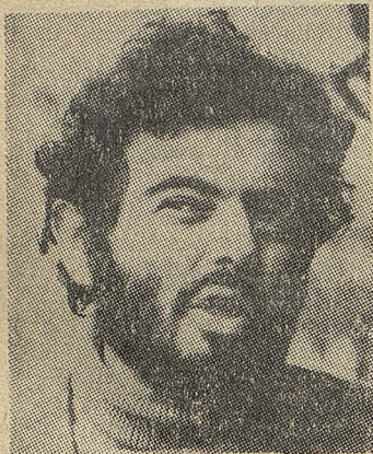
Glauber, un cineasta que resistió a la Dictadura Militar y puso su arte al servicio del pueblo.

Luego de haber destruído y controlado todas las organizaciones de trabajadores, la contrarrevolución avanzó en las otras manifestaciones culturales del pueblo brasileño y en todos sus canales de expresión.