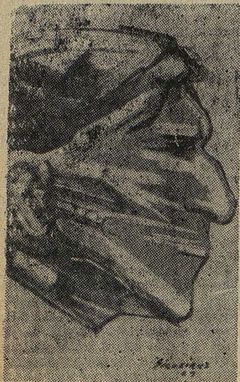
JOSE CARLOS MARIATEGUI

Es en los Archivos de la Clase Obrera que debemos buscar los elementos para eso.