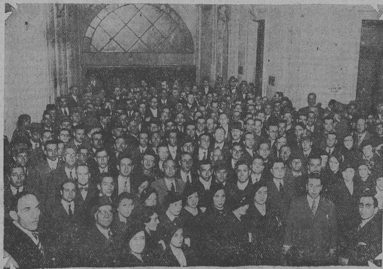
GRUPO DE EMPLEADOS DE COMERCIO QUE AYER VISITARON NUESTRA REDACCION PARA agradecer las campañas que el diario ha realizado en favor de la reforma de los artículos 157 al 160 del código de comercio

EXPEDICION AL POLO NORTE. (1908). — El comandante Roberto Peary, que ya había realizado en 1905 una expedición al polo norte, intenta una segunda, saliendo al efecto del puerto de Nueva York en el "Roosevelt". Hizo primera escala en Hawks-Harbor, tocando luego en la isla Turnavick, y atravesó el Círculo Polar el 26 de julio. Después de una lucha formidable contra los hielos, el buque dobó el cabo Rawson el 5 de septiembre, acordando entonces los expedicionarios invernar en el cabo Sheridan. Después de la noche polar, que duró hasta principios de marzo, y en la que utilizaron para alumbrarse los reflectores del "Roosevelt", emprendieron la marcha a través del hielo, con una temperatura de 50 grados bajo cero, llegando a pisar el 7 de abril, el sitio del planeta donde se confunden los cuatro puntos cardinales.