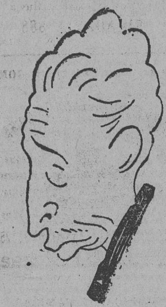
PRESIDENTE DE LA GENERALIDAD DE CATALUÑA.

ve para hoy, y recomienda a sus afiliados a que estén alerta, porque aun subsisten los motivos de alarma.