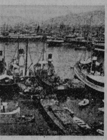
GRECIA. — EL PIREO

El Plan Marshall y la ayuda a Grecia.— La ayuda militar americana se ha cifrado en 1947-48, en 200 millones de dólares. Una parte importante fue consagrada a importaciones de necesidad vital; otra,