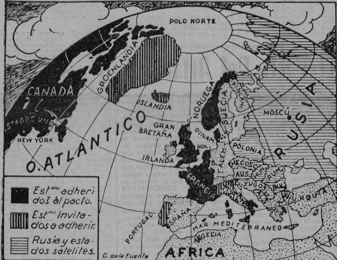
Estados adheridos al pacto. Estados invitados a adherirse. Rusia y sus Estados satélites.

Rusia, al igual que pactó con Hitler y Mussolini, pactaría hoy con Truman. Es posible que lo haga, cuando tal decisión sea indispensable para sus intereses. No es el capitalismo norteamericano un obstáculo para Stalin, como no lo es el régimen de Perón, para mantener con la Argentina relaciones diplomáticas y comerciales. Los Estados no suelen preocuparse gran cosa de los principios, de los escrúpulos doctrinales, y desde ese punto de vista, Stalin es un maestro consumado.