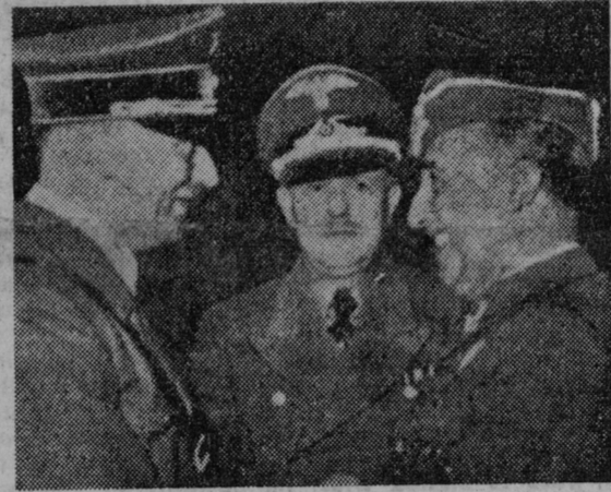
Los dos amigos sonríen ante la « victoria » que dan como segura contra las Democracias.