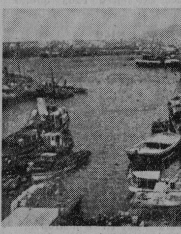
GRECIA. — EL PIREO

Los alemanes, en su retirada, habían incendiado centenares de aldeas y poblados; las ruinas no han sido restablecidas. Arrabalaron, aquellos, una parte importante de la ciudad, las finanzas públicas