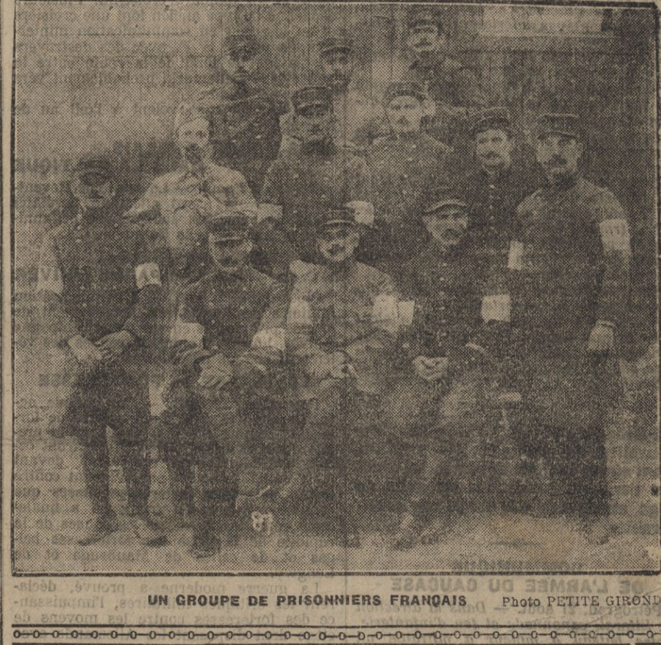
UN GROUPE DE PRISONNIERS FRANÇAIS