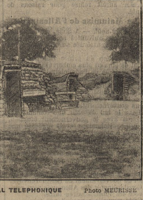
UN GROUPE DE « TERRIBLES TORIAUX » DU 133e