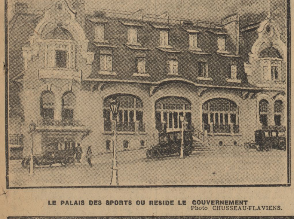
LE PALAIS DES SPORTS OU RESIDE LE GOUVERNEMENT.