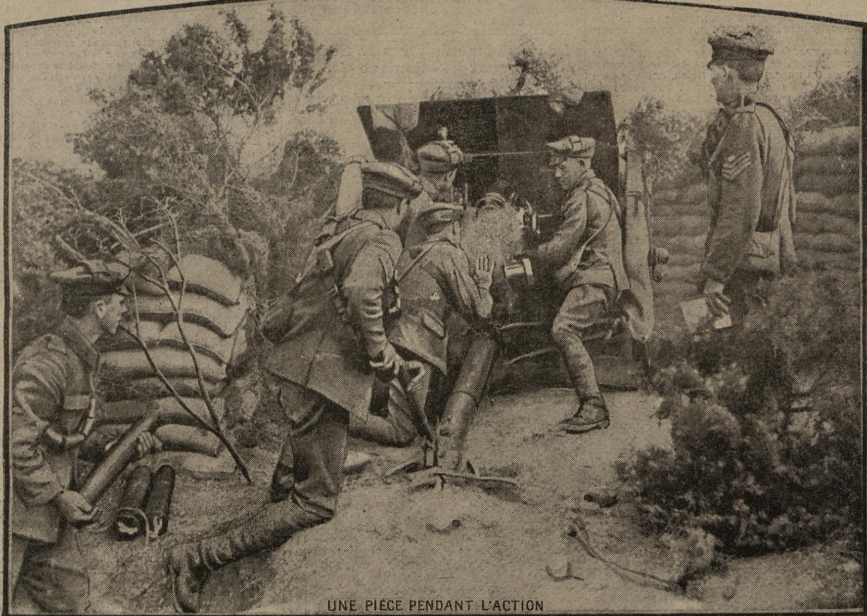
UNE PIÈCE PENDANT L'ACTION

Il ne se produit en ce moment, sur le front britannique, aucune action d'importance. Cependant, l'artillerie continue à tonner, et l'aviation, ne se laissant point rebuter par la saison défavorable, rend quotidiennement des services appréciables. Il ne se passe pas de jour sans que nos alliés ne ramènent dans leurs lignes des prisonniers, officiers et soldats. A l'arrière, le ravitaillement se poursuit avec une activité fébrile.