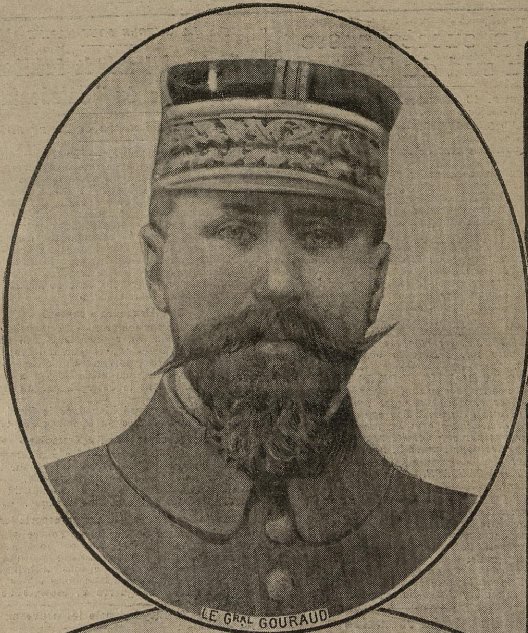
LE GRAL GOURAUD