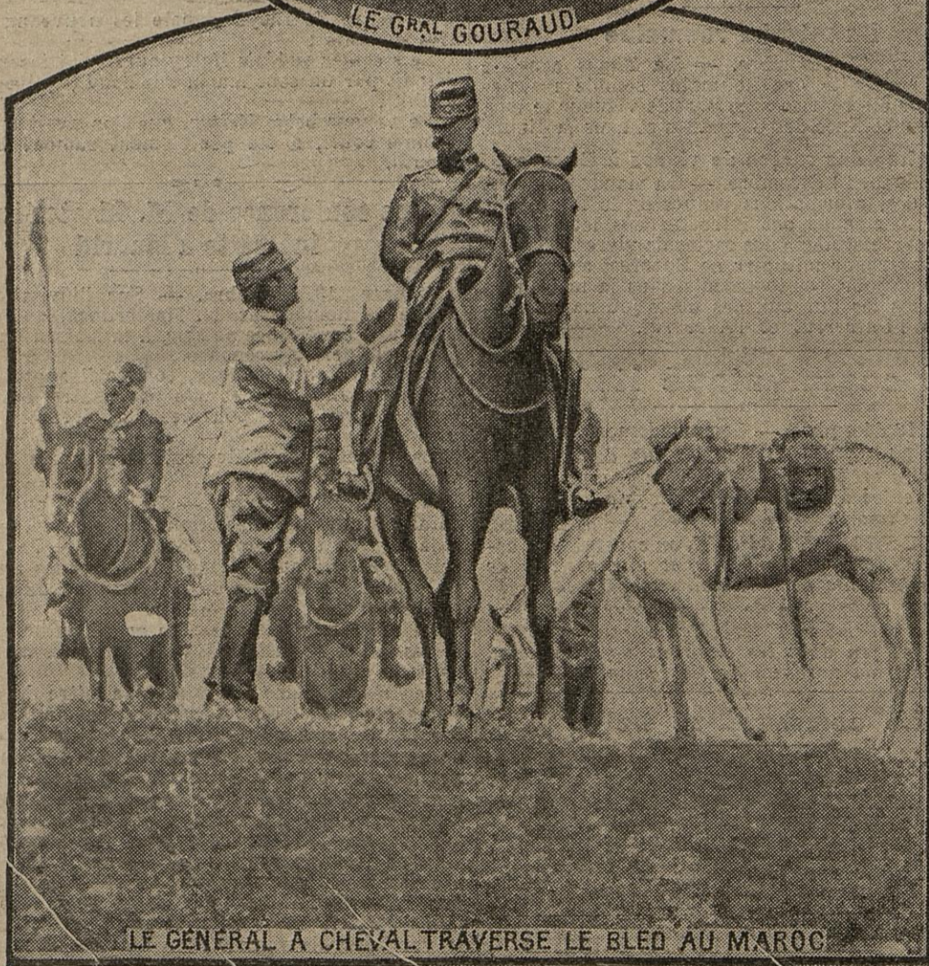
LE GÉNÉRAL A CHEVAL TRAVERSE LE BLED AU MAROC