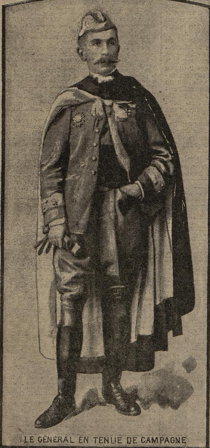
LE GÉNÉRAL EN TENUE DE CAMPAGNE