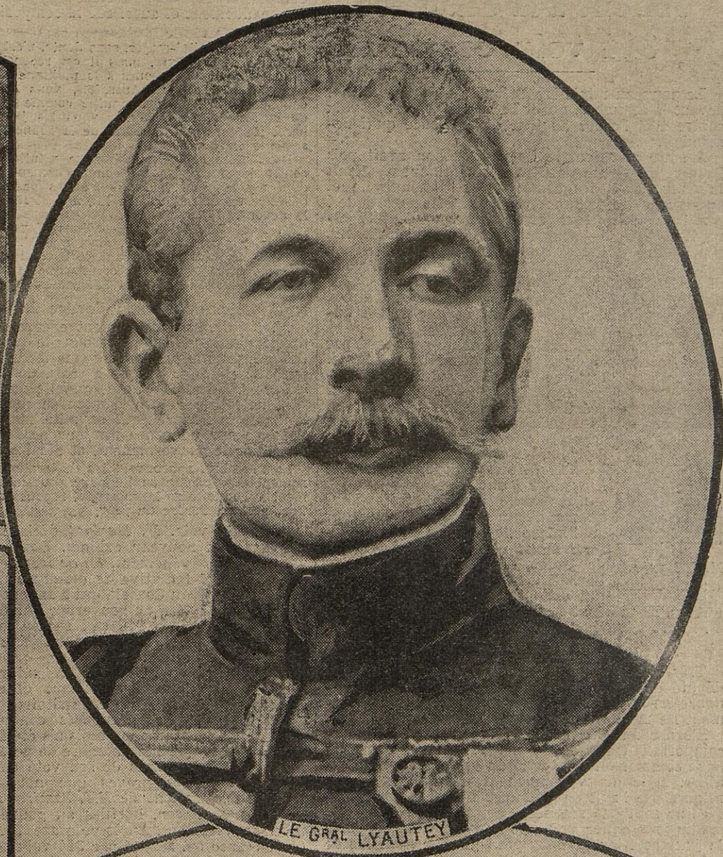
LE GRAL LYAUTEY