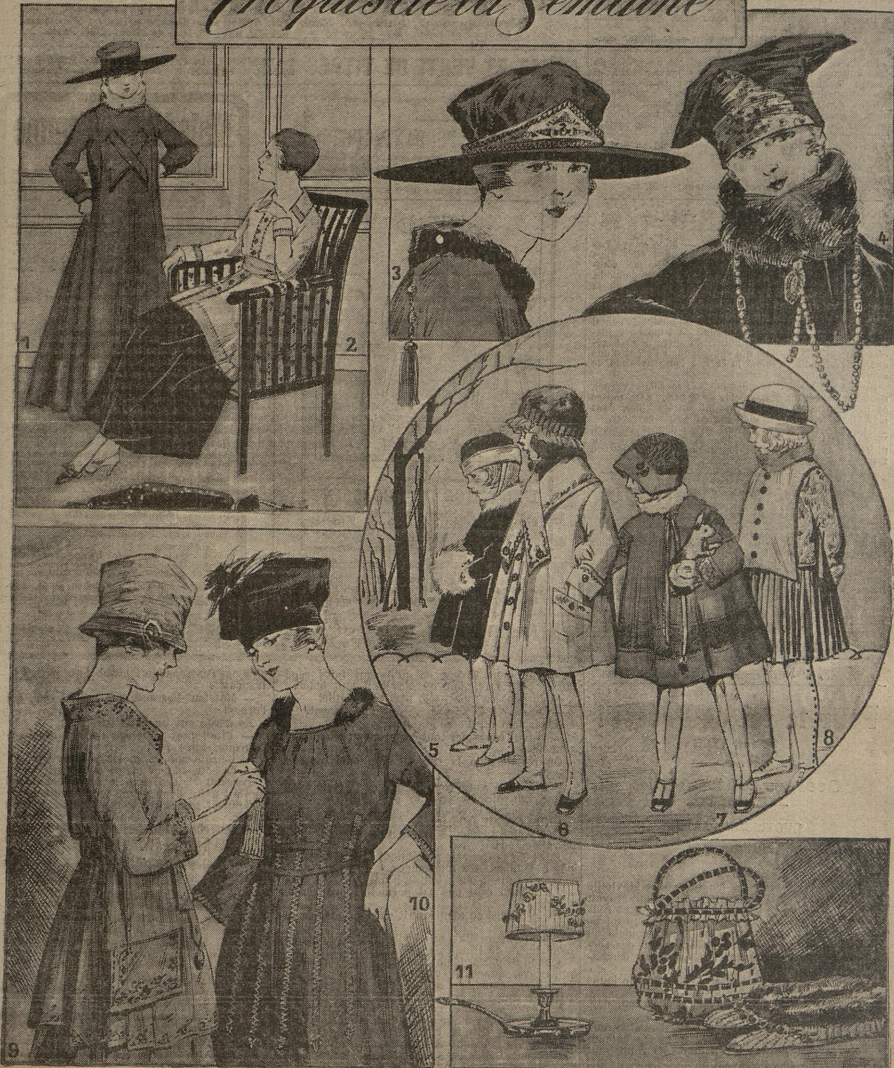
1. Robe-manteau en velours de laine prune, à col d'hermine. — 2. Tunique de mousseline gris perle ourlée de mousseline fumée. Jupe de velours fumée. — 3. Chapeau de peluche noire, cerclé d'un bandeau soutaché. — 4. Toque de velours noir garnie d'une pointe brodée d'or et de chenille turquoise. — 5. Manteau et toque de velours châtaigne. — 6. Manteau de drap gris brodé bleu. — 7. Rotonde et bonnet de bure soutachée. — 8. Robe de drap gris acier. — 9. Robe