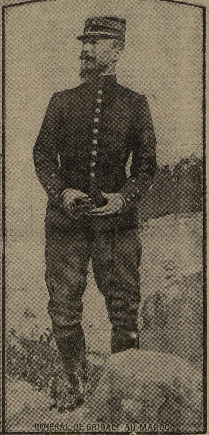
GÉNÉRAL DE BRIGADE AU MAROC

L'un des chefs les plus populaires de l'armée française, le général Gouraud, vient d'être promu au poste de résident général au Maroc, en remplacement du général Lyautey. Avant de prendre une si brillante part aux opérations de la guerre, le héros de Sebdi-Bahr avait activement collaboré à la pacification marocaine. Agé seulement de quarante-neuf ans, il fut le plus jeune de nos généraux. Au Soudan, en Mauritanie, il se distingua comme chef colonial, et aucun choix ne pouvait être fait pour donner,