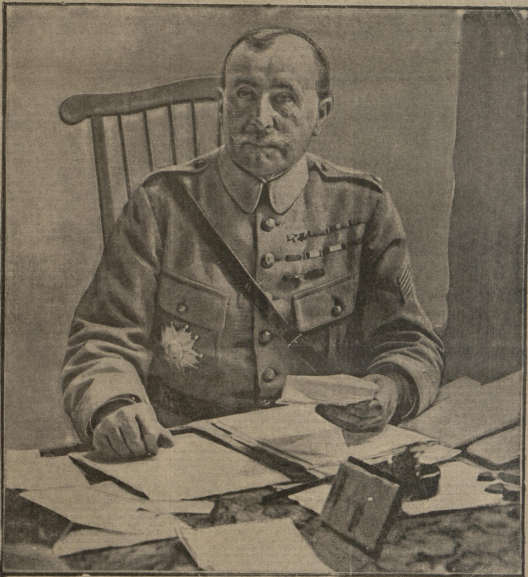
Le général Nivelle, dont la haute valeur militaire avait été si magnifiquement affirmée par la tenace résistance de son armée de Verdun, a été nommé général en chef des armées du Nord et du Nord-Est. Simple colonel au début de la guerre, promu général en octobre 1914, divisionnaire en février 1915, puis, un peu plus tard, commandant le III e corps d'armée, il s'y illustra sur la Meuse avant de remplacer le général Petain sous Verdun.