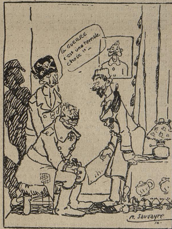
LES PROPOSITIONS DE PAIX BOCHES !

— Eh bien, Bethmann, comment accueillent-ils notre colombe de paix ?