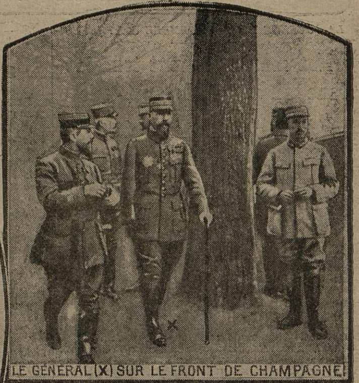
LE GENERAL (X) SUR LE FRONT DE CHAMPAGNE