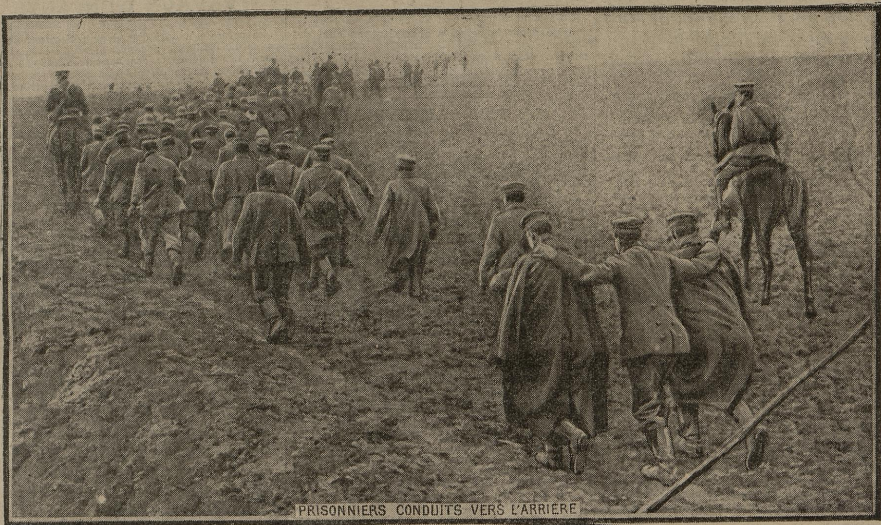
PRISONNIERS CONDUITS VERS L'ARRIERE