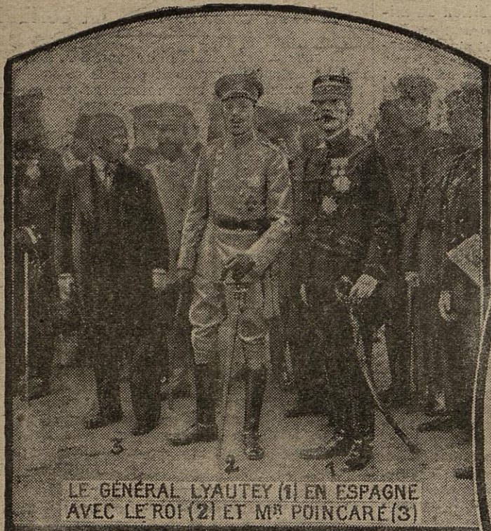
LE GÉNÉRAL LYAUTEY (1) EN ESPAGNE AVEC LE ROI (2) ET M rs POINCARÉ (3)