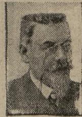
M. C. BENOIST

On discute pendant trois bons quarts d'heure à propos du tour de l'interpellation de M. Charles Benoist visant les événements de Grèce, dont le président du Conseil demande l'ajournement, et qui est finalement retirée par son auteur. Et le débat s'engage sur l'interpellation de M. André Tardieu.