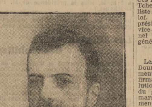
Le grand-duc Michel, Alexandrovitch, frère du tsar, a été nommé régent de l'empire.