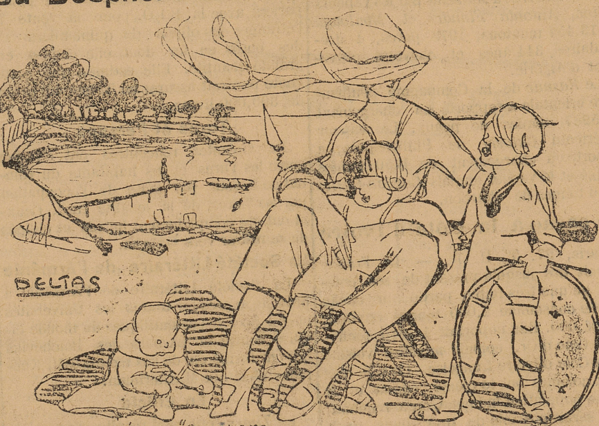
« Glâche du Bosphore » — Respirez mes petits, respirez bien... C'est un air qui nous revient à 5 livres le mètre cube !