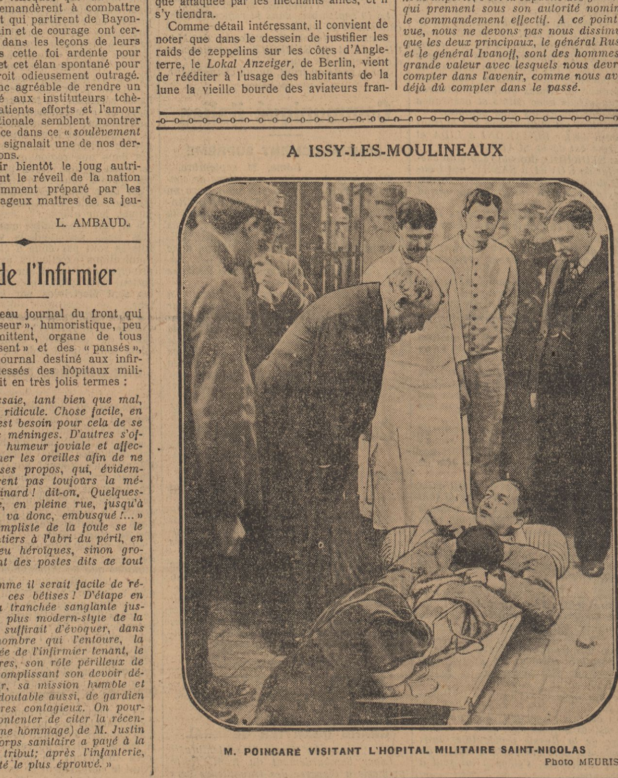
M. POINCARÉ VISITANT L'HOPITAL MILITAIRE SAINT-NICOLAS.