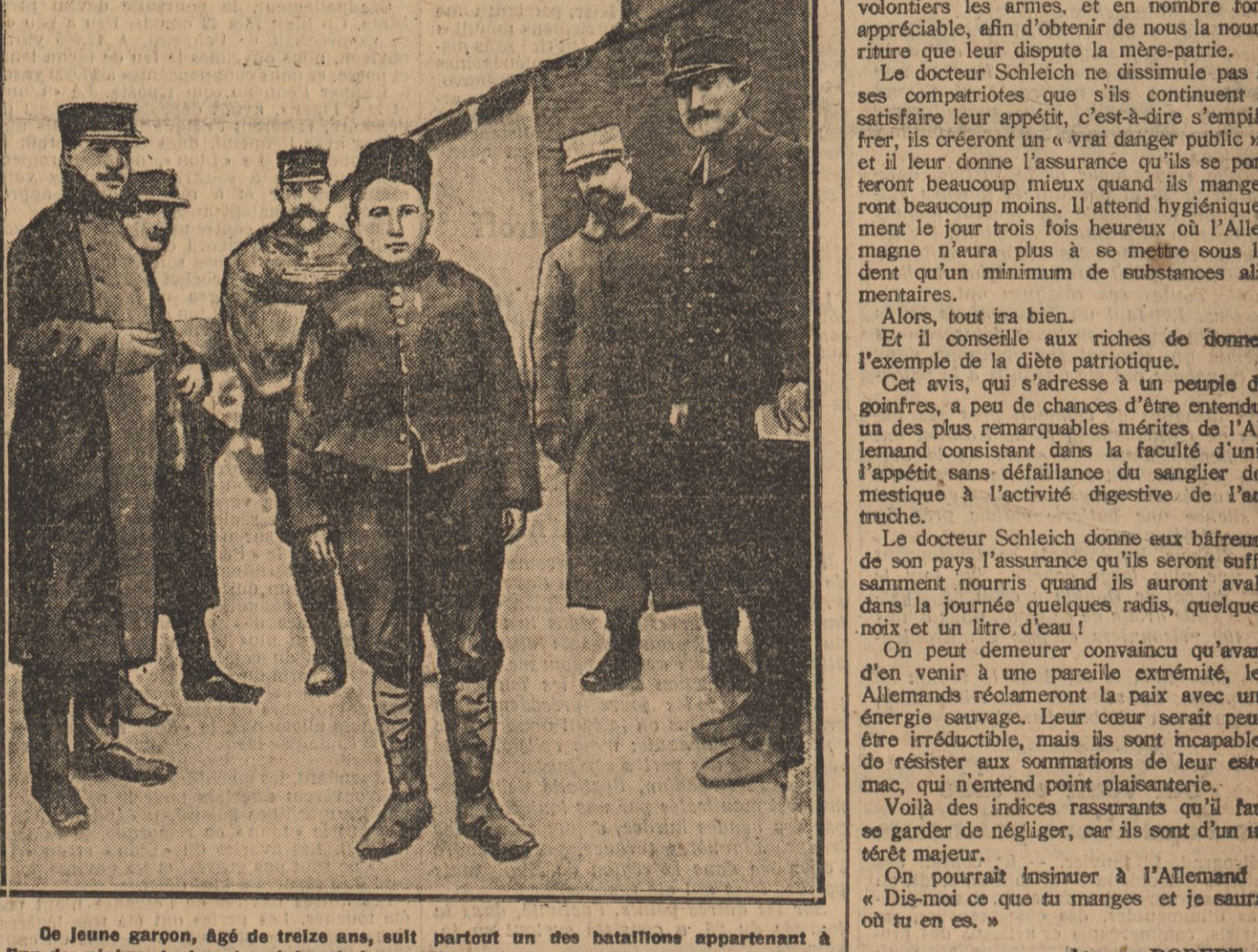
De jeune garçon, âgé de treize ans, suit partout un des bataillons appartenant à l'un des régiments de notre région, le brave 257.