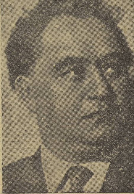
El 18 de junio el camarada Jorge Dimitroff ha cumplido sesenta y cuatro años. En esa fecha el Partido Comunista de España dirige un caluroso saludo a este gran paladín del antifascismo mundial.