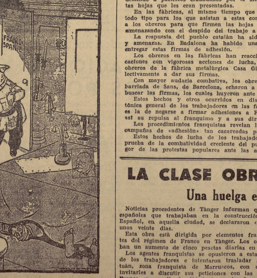
(Caricatura publicada en un periódico holandés.)

¡PASEN, SEÑORES, PASEN. TODO ESTA EN ORDEN.