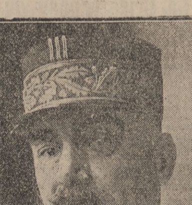
GENERAL GUILLEMIN, Directeur du Service aéronautique

L'inspiration humaine ne pouvait prévoir le nombre des moyens mis en action dans la bataille moderne. Les combats gigantesques qui se livrent chaque jour sont le résultat de tels efforts que l'on est tenté de croire à l'impossibilité d'un progrès de nouveaux points de vue des inventions.