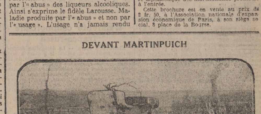
UN CANON ALLEMAND DETRUIT