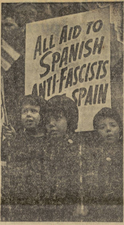
Con un grupo de colecta. Escenas de movilizaciones anteriormente realizadas por los amigos de España republicana en los Estados Unidos.

Estaban anunciados otros mítines, particularmente en Manhattan y Brooklyn.