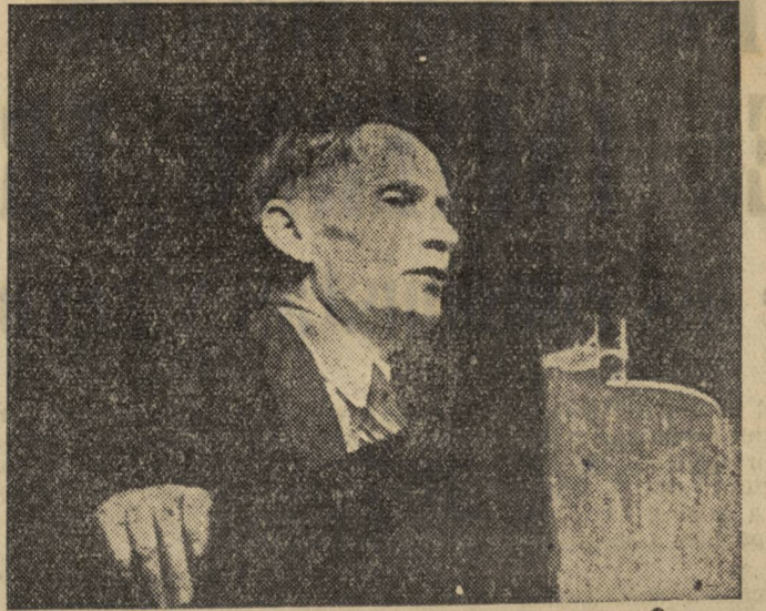
T. Lisenko, pronunciando un discurso en la Academia de Ciencias de la U.R.S.S.

Por fortuna, el pueblo rechazó a tiempo esta pseudociencia germano-norteamericana, importada. «Y el weismannista redomado llegaba al despacho del presidente de la Academia de Ciencias Agrícolas «Lenin», enarbolando bandera blanca. Preguntó a Trofim Denisovich si este le ayudaría a él, que el día antes era aún un convencido weismannista, a «readaptarse», a la biología michuriniana. Lisenko apagó el cigarrillo contra el cenicero. — No entiendo, a ciencia cierta, lo que usted quiere de mí-le objetó. El visitante se puso colorado. — Saber si va a ayudarme usted. — ¿Yo le derroté a usted?—preguntó Lisenko en tono tajante. — Sí... me derrotó. — Entonces ¿cómo dice usted que no le ha ayudado? Y seguiré derrotándole. La derrota del error es la mejor forma de ayuda al hombre de ciencia, a condición de que su error sea sincero. El visitante se mostró semiofendido. — Yo pienso que en lo que atañe a mí sinceridad... — ¡Esas tenemos!... Entonces dígame el conoce usted este experimento nuestro?—preguntó Lisenko, poniéndose de pie. Un instante después los visitantes estaban ante un cajoncillo abierto. En él, tan solo había unas ramitas con frutos de tomate.