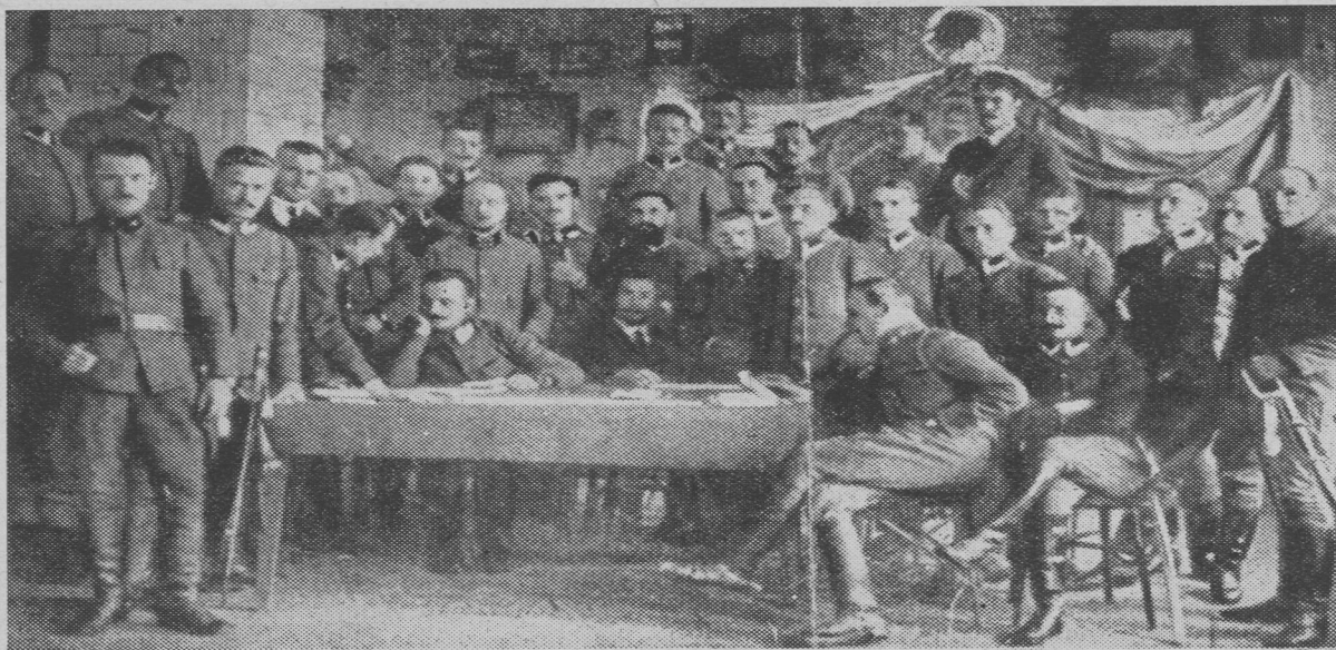
Konferencja oficerów werbunkowych do Legionów Polskich, zorganizowana przez Departament Wojskowy Naczelnego Komitetu Narodowego—Piotrków kwiecień 1915.

Nocą z dwunastego na trzynastego września, gdy sznur aut rządowych mknął w kierunku Zaleszczyk i Kut, jedyny może samochód, jaki opuszczał Lwów w kierunku na północ był ten, który wioził generała Sikorskiego. Jechał w kierunku Hrubieszowa, by uzyskać możliwość walki w obronie upadającego kraju.