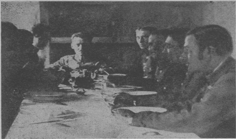
Sikorski wśród swoich żołnierzy w Rohatynie w r. 1919