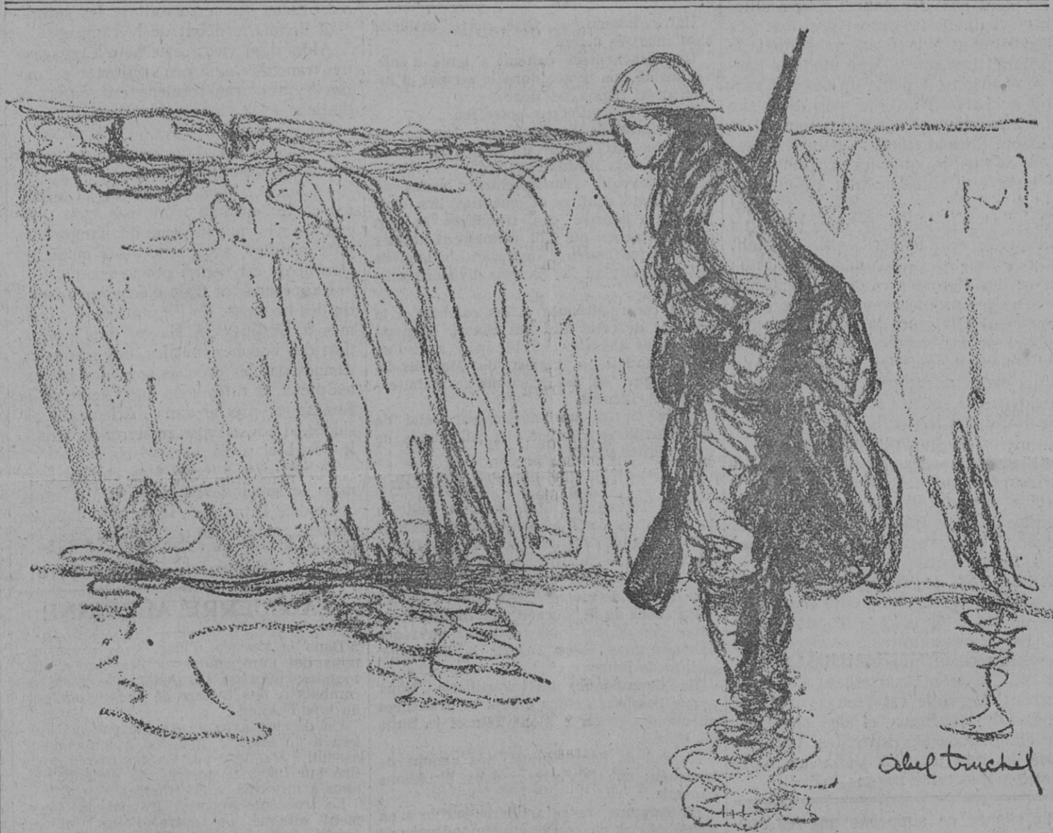
— Zut !... v'la mes souliers qui prennent l'eau !... —

Nous prions nos abonnés de vouloir bien, pour chaque changement d'adresse, nous envoyer l'une des dernières bandes de leur journal, en l'accompagnant de 0 fr. 50 en timbres-poste.