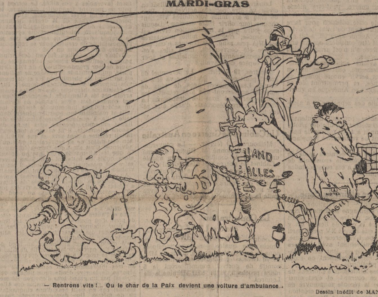
Retrons vite ! Ou le char de la Paix devient une voiture d'ambulance.

La Chambre a abordé — enfin ! — la discussion de la réforme du régime des entrepôts. C'est en 1910 que, sur ma proposition, elle avait invité le gouvernement à entreprendre l'étude dans le but de favoriser notre exportation. Il a donc fallu sept années d'enquête, de travaux de commissions interminables ou parlementaires pour aboutir à quelques modifications qui ne manifestent pas l'insuffisance du régime actuel des entrepôts. Nous ne marchons pourtant pas à l'aventure. Il est très facile d'aviser plus tôt.