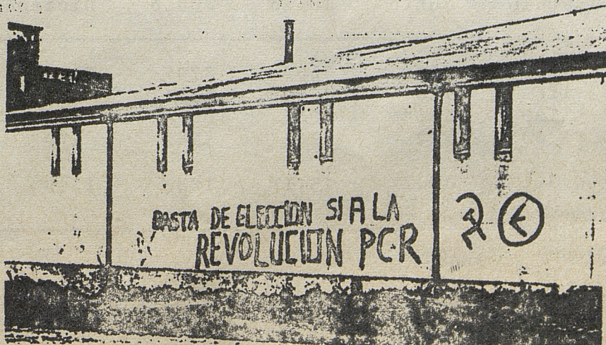
FOTOGRAFIA PUBLICADA EN EL AÑO 1969 POR "EL PUEBLO", ORGANO DEL P.C.R. DE CHILE