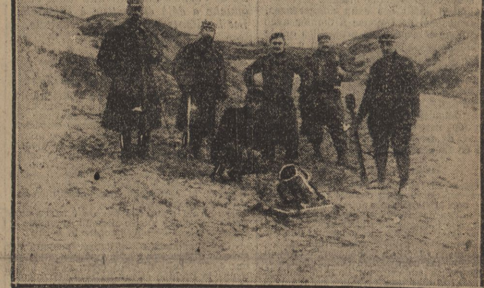
On va tirer le crapouillaud