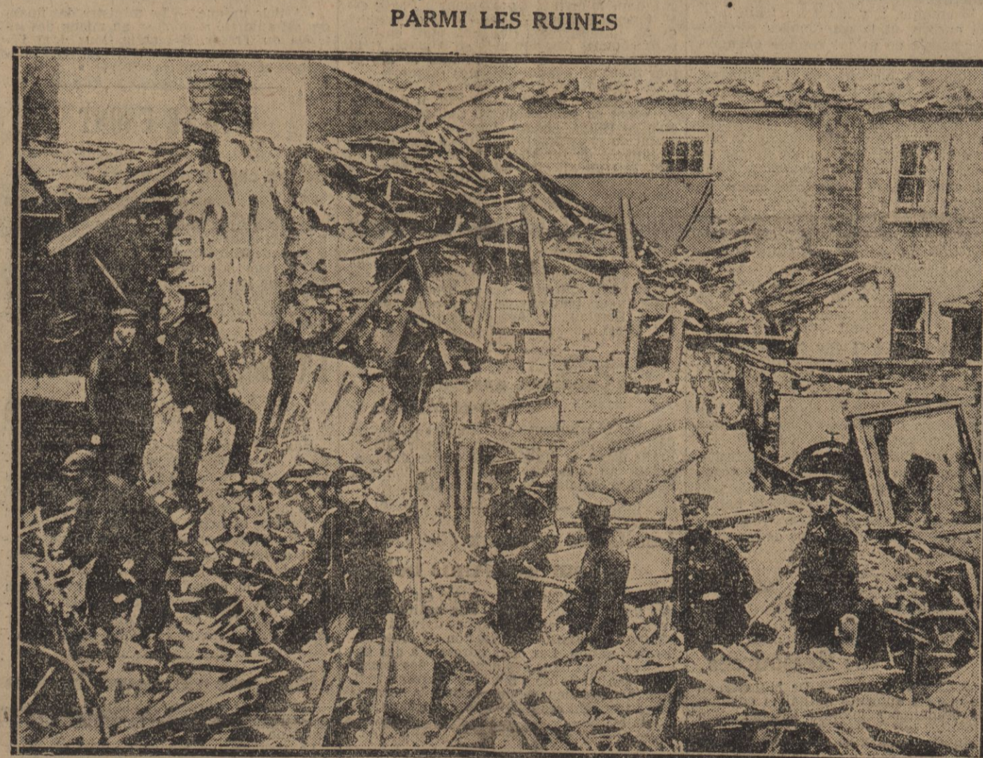
Une patrouille anglaise examinant les ravages causés rue Albert, à King's Lynn, par les projectiles des Zeppelins

Le ministre de l'Intérieur multipliait les circulaires explicatives sans parvenir à dissiper les obscurités et sans faire taire les réclamations. Finalement il institua une commission supérieure destinée à résoudre, de Paris, les conflits soulevés dans nos communes rurales entre les commissions cantonales et les commissions d'appel, et condamnée peut-être à n'être qu'un rouage supplémentaire aussi inutile que décoratif.