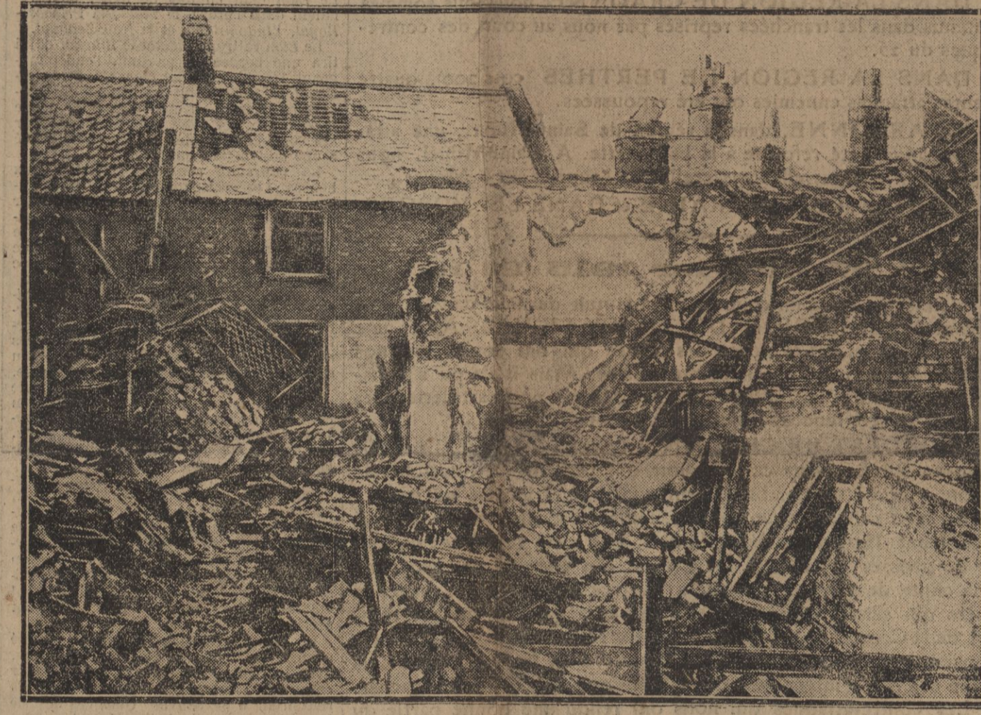
LA RUE BENTONK A KING'S LYNN