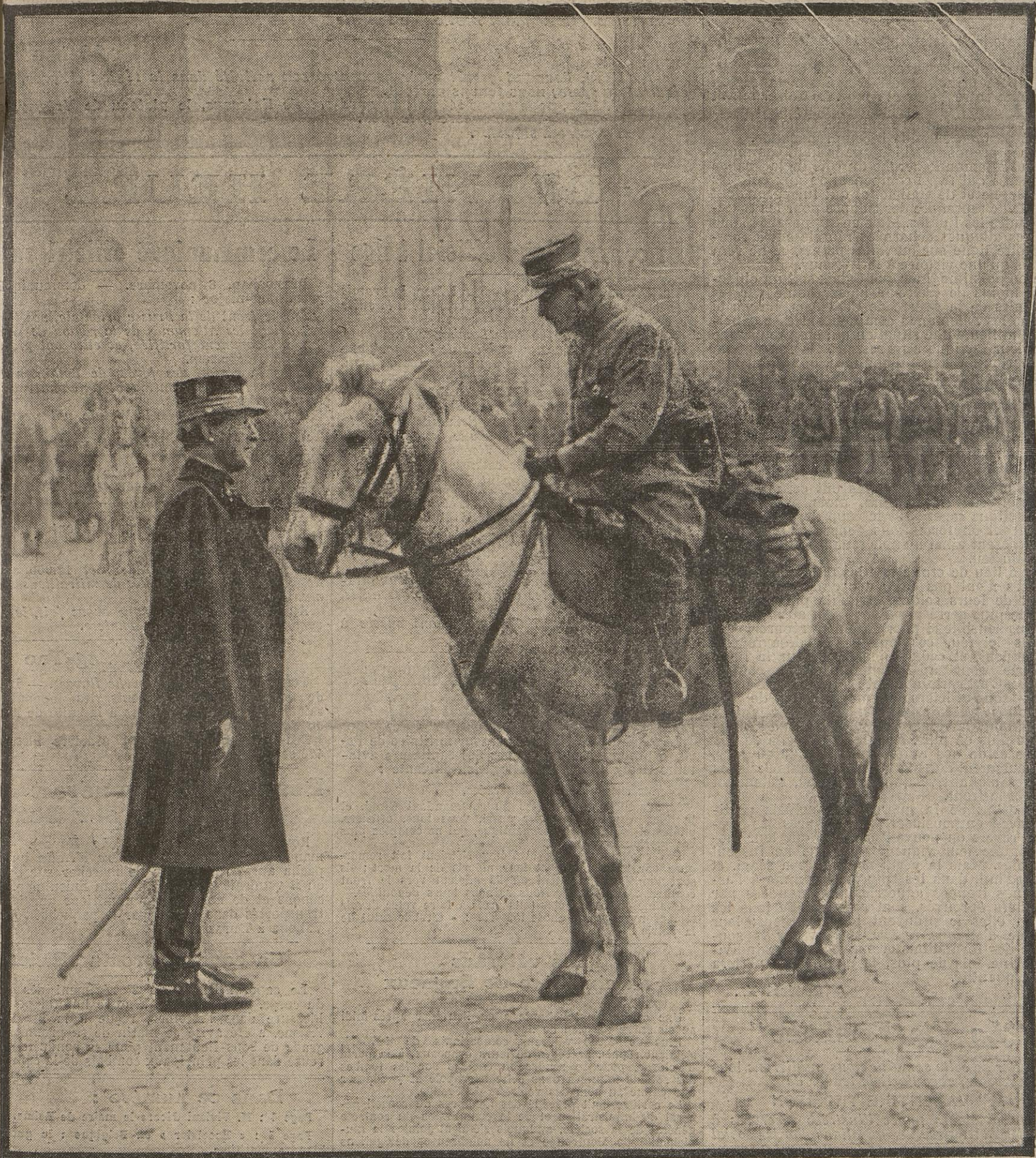
A Furnes, ces jours derniers, le roi des Belges assista au défilé d'un bataillon de tirailleurs algériens qui venaient, avec des chasseurs à pied, de reprendre aux Allemands la petite ville de Ramscapelle. Avant de se retirer, le souverain appela d'un geste le commandant des tirailleurs pour le féliciter de la conduite héroïque de ses troupes.

Les souverains anglais visitent les blessés au camp d'Althorp