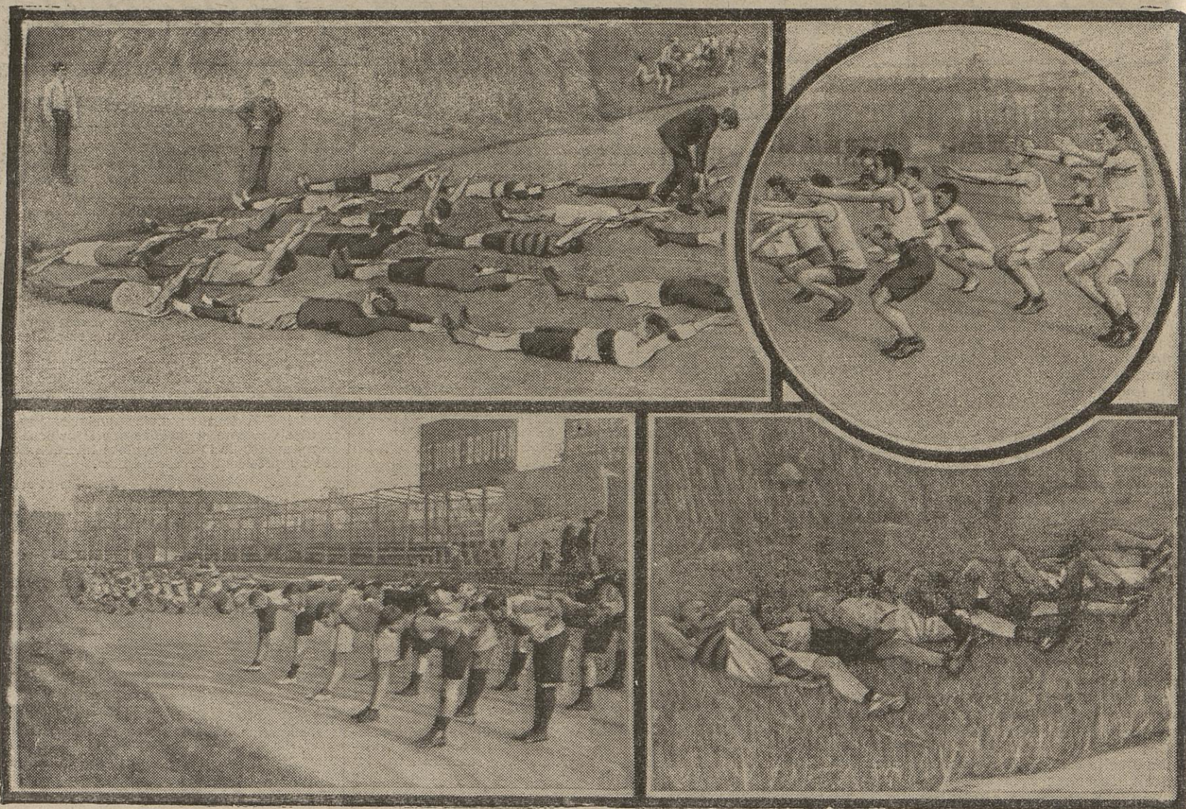
Parmi les initiatives qui signalent déjà l'heureuse activité du Comité d'éducation physique de la jeunesse française (région de Paris), mentionnons l'institution de cours de culture physique. Ils viennent de s'ouvrir au vélodrome du Parc des Princes, et la première leçon ne réunit pas moins d'une soixantaine d'élèves.