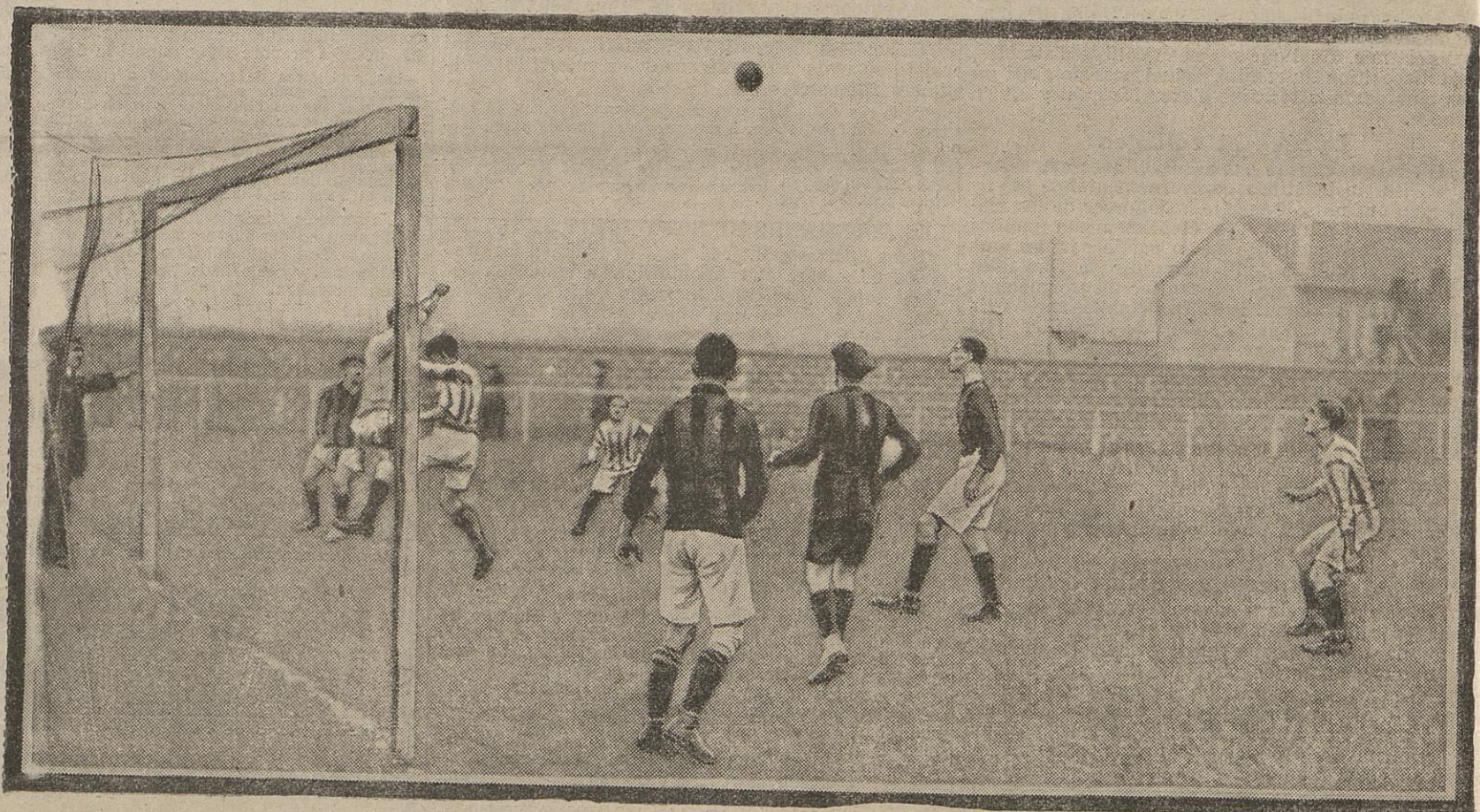
Hier, sur le terrain du Général-Roguet, à Clichy, s'est disputé un match de football association entre l'équipe mixte du Red Star et de la J. A. de Saint-Ouen contre l'U. S. A. de Clichy. Ce match était la revanche de celui qui s'est joué il y a environ un mois à Saint-Ouen et qui se termina par la victoire de l'équipe mixte par 2 buts à 1. Notre photo représente la défense du but de l'U. S. A. de Clichy.