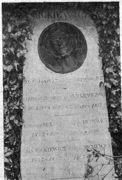
MONUMENT D'ADAM MICKIEWICZ AU CIMETIÈRE DE MONTMORENCY.

Né en 1758 à Skoki en Lithuanie. Il accompagna le prince Adam Czartoryski dans ses voyages à l'étranger et c'est ainsi qu'il visita Leipzig, Vienne, l'Italie. En 1790, il fit jouer à Varsovie une pièce politique : le Retour du nonce , qui obtint un grand succès. Pendant la guerre contre la Russie en 1794, il fut aide de camp de Kościuszko; après sa défaite il fut interné à Pétersbourg. Rendu à la liberté par le tsar Paul I er , il voyagea en Amérique et là il épousa une jeune veuve, M me Levingston-Keane. Il retourna en Pologne lors de la création du duché de Varsovie en 1806, et devint secrétaire du Sénat et membre de la Commission d'Instruction Publique. Il fit jouer diverses pièces de théâtre et publia, en 1816, la première partie de ses Chants historiques qui lui valurent une grande popularité. On lui doit aussi des fables, des romans, une Histoire de Sigismund III , des Mémoires . Il dut émigrer après la révolution de 1831 et se réfugia en Angleterre d'abord, puis en France, où il mourut à Montmorency en 1841.