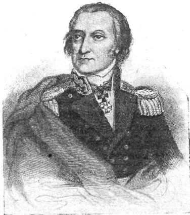
KNIAZIEWICZ CHARLES, Général polonais.

Né près de Mitau en 1762, il était lieutenant en 1792, lorsque commença la guerre contre la Russie. Il prit une part brillante à l'insurrection de Kościuszko en 1794, et fut promu général de brigade après la levée du siège de Varsovie par les Russes. Fait prisonnier à la fatale journée de Maciejowice, il fut rendu à la liberté en 1796. Deux ans plus tard il entra dans les légions polonaises que Dombrowski organisait en Italie au profit de la France. Il se signala à Rome et à Naples sous les ordres du général Championnet. Il se fit aussi remarquer à Magliano, à Termini, fit capituler, par un coup d'audace, la place de Gaète, et fut envoyé à Paris pour porter au Directoire les drapeaux pris sur l'ennemi. En 1800, il se signala durant la campagne du Rhin. Mais, découragé de voir Bonaparte ne rien tenter pour sauver la Pologne, il donna sa démission en 1801 et se retira en Pologne. En 1812 cependant, il reprit les armes et se distingua à la Moskowa et à la Bérésina, où il fut grièvement blessé. Lors de l'insurrection de 1830-31, Kniaziewicz fut chargé d'affaires du gouvernement national à Paris. Il y est mort en 1842 et fut inhumé à Montmorency.