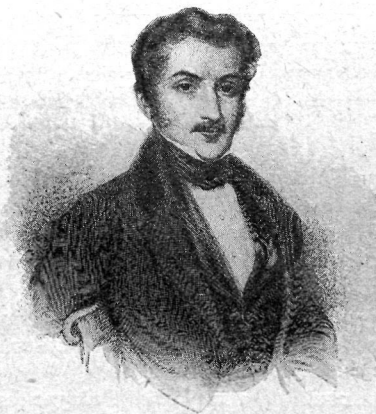
ALEXANDRE-EDMOND-BOREJKO CHODŹKO Écrivain et savant polonais.

Né près de Mitau en 1762, il était lieutenant en 1792, lorsque commença la guerre contre la Russie. Il prit une part brillante à l'insurrection de Kościuszko en 1794, et fut promu général de brigade après la levée du siège de Varsovie par les Russes. Fait prisonnier à la fatale journée de Maciejowice, il fut rendu à la liberté en 1796. Deux ans plus tard il entra dans les légions polonaises que Dombrowski organisait en Italie au profit de la France. Il se signala à Rome et à Naples sous les ordres du général Championnet. Il se fit aussi remarquer à Magliano, à Termini, fit capituler, par un coup d'audace, la place de Gaète, et fut envoyé à Paris pour porter au Directoire les drapeaux pris sur l'ennemi. En 1800, il se signala durant la campagne du Rhin. Mais, découragé de voir Bonaparte ne rien tenter pour sauver la Pologne, il donna sa démission en 1801 et se retira en Pologne. En 1812 cependant, il reprit les armes et se distingua à la Moskowa et à la Bérésina, où il fut grièvement blessé. Lors de l'insurrection de 1830-31, Kniaziewicz fut chargé d'affaires du gouvernement national à Paris. Il y est mort en 1842 et fut inhumé à Montmorency.