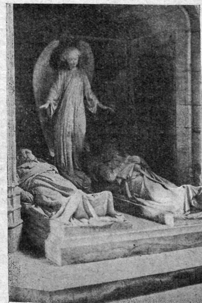
MONUMENT DE KNIAZIEWICZ ET NIEMCEWICZ DANS L'ÉGLISE DE SAINT-MARTIN A MONTMORENCY